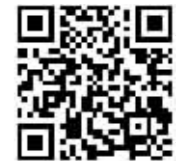
扫描二维码看“冰城+”视频