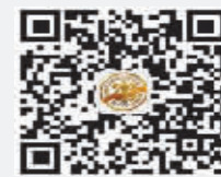
加微信、赢门票 关注最新演出资讯, 请加入我们的官方公众 微信:yy0451

北京大学百年周年纪念讲堂室内合唱团 《雪花的快乐》合唱音乐会 演出时间 2025年1月19日 15:00 演出票价 50元(惠民)/80元/120元/ 180元/880元(VIP) 演出地点:哈尔滨音乐厅(群力大道1号) 业务电话:0451-84692455 售票电话:0451-84699400