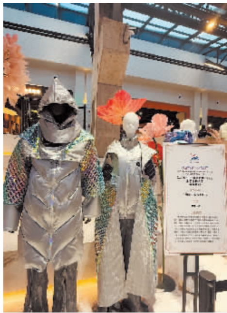
以雪景为灵感的作品《彩》。运用赫哲族鱼皮工艺的作品《雪韵·与光同行》。