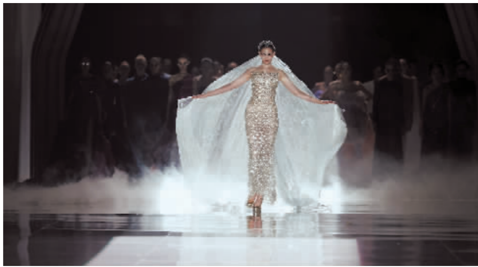
冰雪元素的使用成为本届时装周风尚。

计赋能。时装周为服装设计师、艺术家们搭建了一个平台,实现展示、交流、共享、合作的目的。哈尔滨蕴含着典型的中西合璧文化底蕴,而时装周的举办地——西城红场,拥有美术馆、秀场等场所,经常会举办各类展览以及艺术节,这里有丰富的艺术、文化的呈现形式……在这里可以为设计师、艺术家们提供更为广阔的思路。