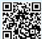
扫描二维码看“冰城+”视频