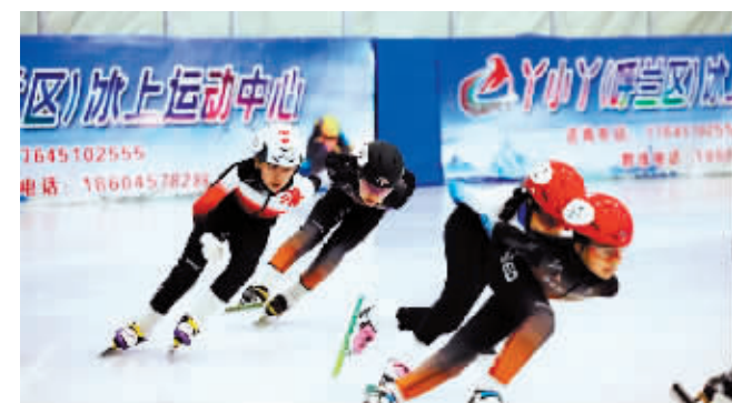
赛场上小将们上演速度与激情。

本报(记者 那跃娜)11月11日,2024-2025“奔跑吧·少年”哈尔滨市青少年儿童短道速滑系列赛在呼兰区开赛,来自全国的169位小选手参加比赛。