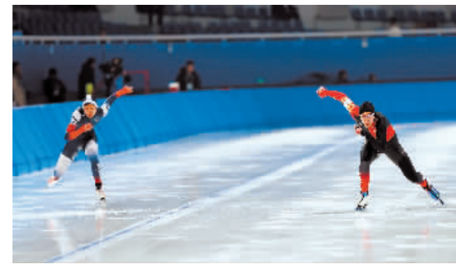
测试赛上的选手。

本报(记者 张望雷)11月12日,亚冬会速度滑冰测试赛在黑龙江省冰上训练中心速滑馆进行了首个比赛日的争夺。这是针对哈尔滨亚冬会速度滑冰项目举行的第二次全要素测试赛,也标志着亚冬会速度滑冰竞赛筹备工作进入最后的冲刺阶段,各领域逐步进入最佳状态,以迎接亚冬会正式比赛的到来。