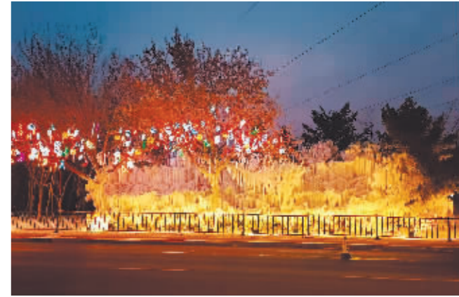
香坊区五彩斑斓的景观灯饰。

本报讯(实习生 刘睿 记者 霍亮文/摄)五彩斑斓的灯光映照在雪屋和冰瀑美景之上,构成梦幻又迷人的夜景。近期,香坊区城管部门完成对辖区景观灯饰提档升级,香坊区的小伙伴想看美丽的城市夜景,在家附近很多街路和区域即可打卡。