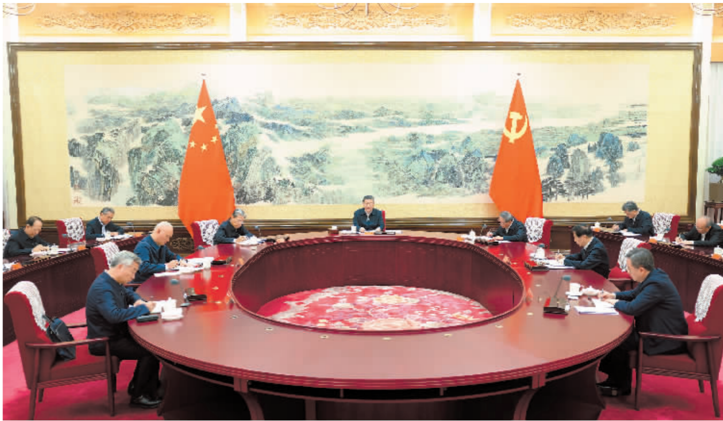
12月26日至27日,中共中央政治局召开民主生活会,中共中央总书记习近平主持会议并发表重要讲话。