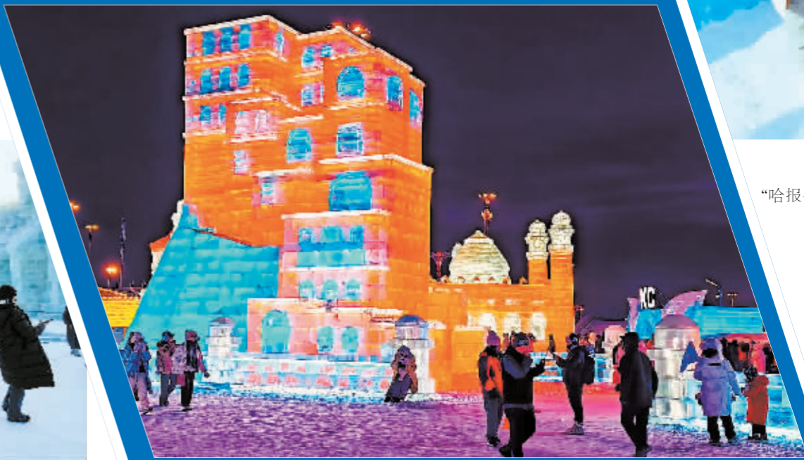
冰景流光溢彩。