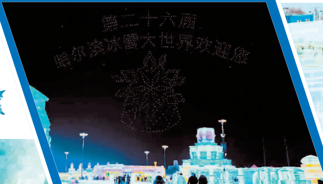
无人机表演。