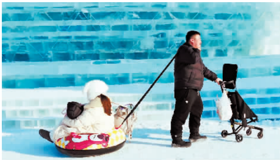
雪圈上的爱。