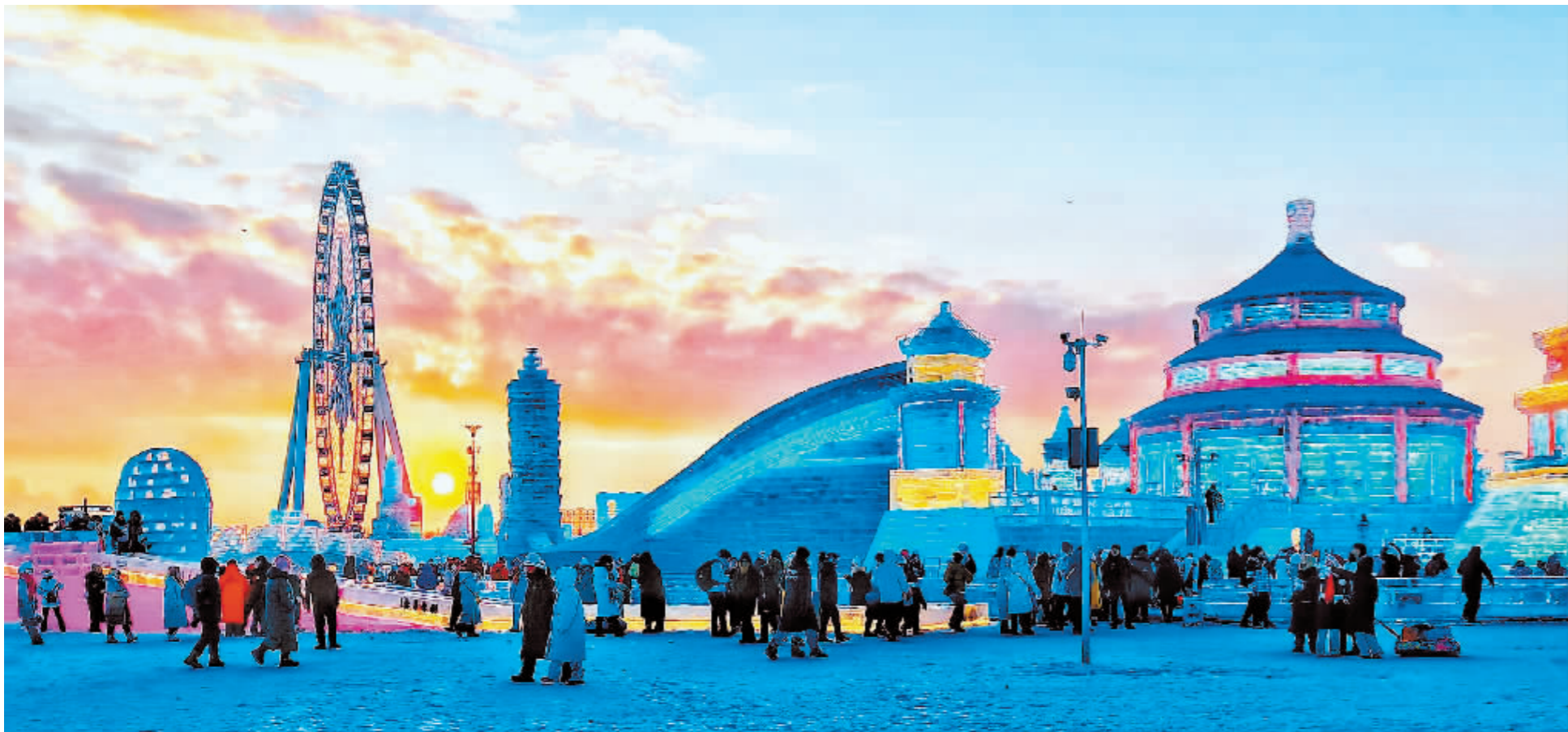
游客在冰雪大世界游玩。