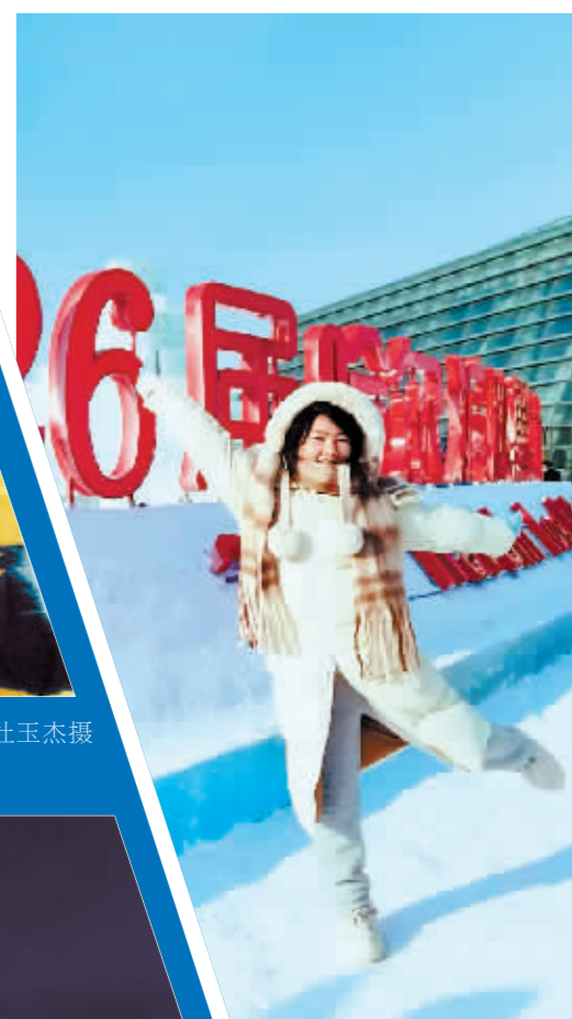
今儿个真高兴。