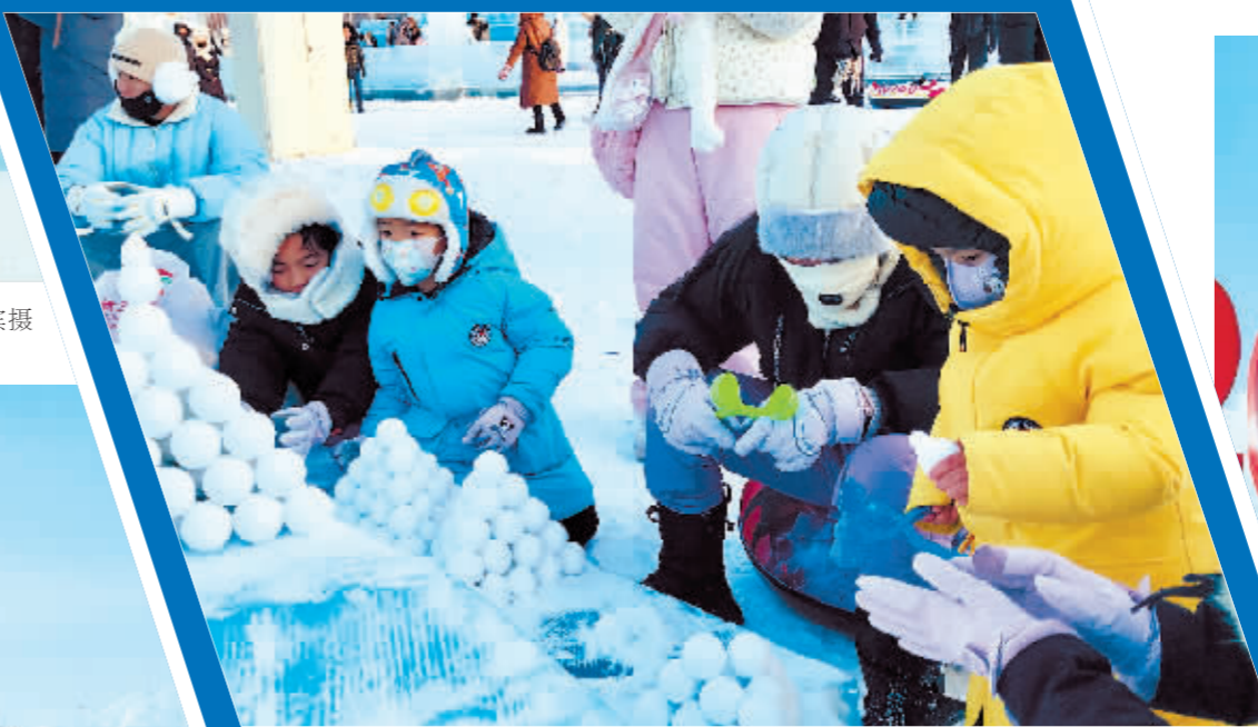
玩得真投入。