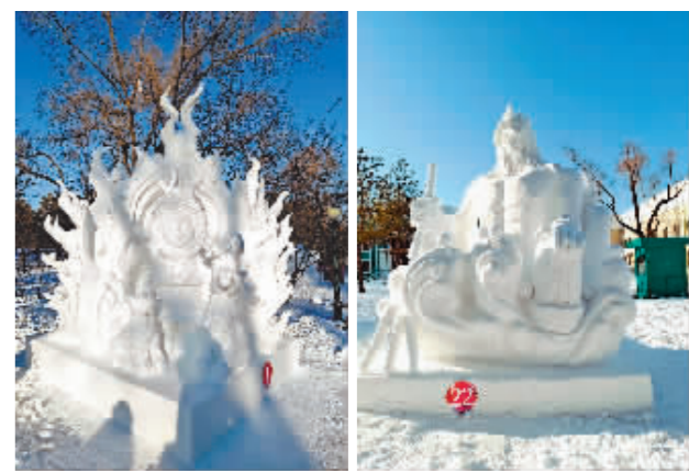
一等奖作品《鄂伦春牧歌》。