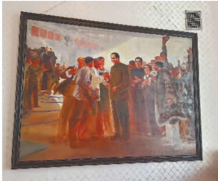
毛主席视察哈尔滨车辆厂的油画。

在哈尔滨市南岗区颐园街1号,矗立着一座庄重典雅的欧式建筑,它不仅是城市历史的一部分,更是革命精神与文化传承的重要载体——革命领袖视察黑龙江纪念馆。这座集欧式古典主义的浪漫庄严与浓郁中国历史文化气息于一身的建筑,以其独特的气质,向世人讲述着毛泽东同志视察黑龙江期间的动人往事,以及党和国家领导人对黑龙江的深切关怀与殷切期望。