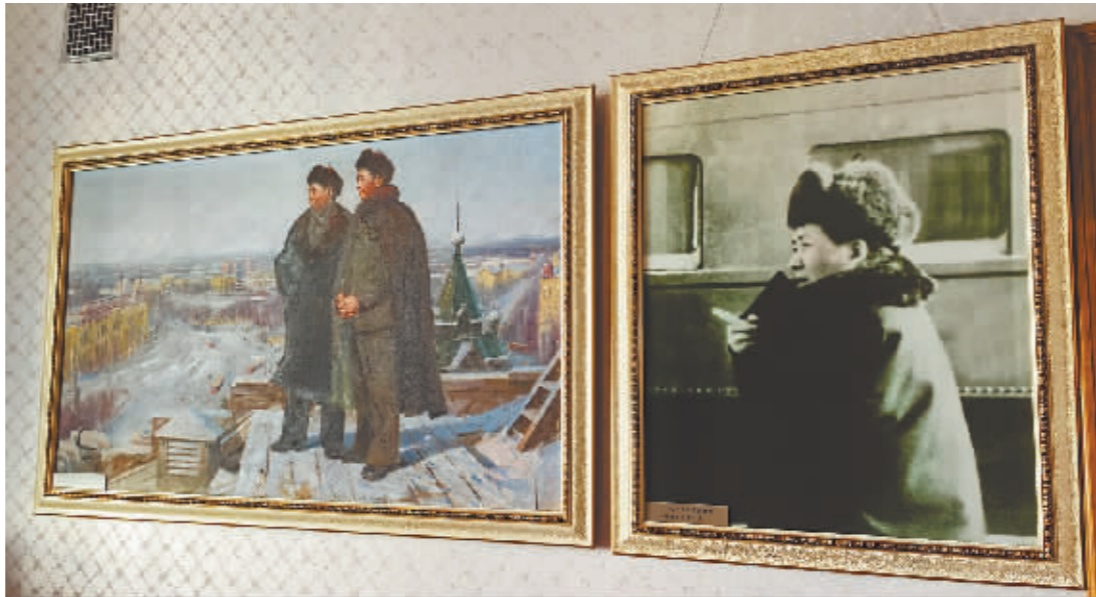
毛泽东同志视察照片。