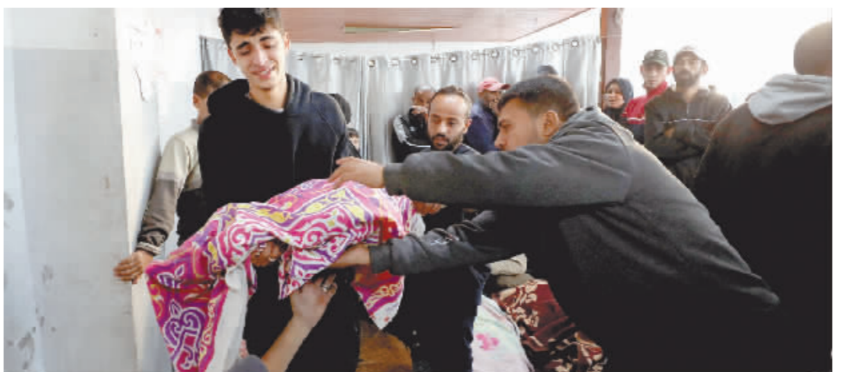
11 月 22 日,在加沙地带加沙城,当地民众悼念在以军袭击中的遇难者。

巴勒斯坦常驻联合国副代表马吉德·巴姆亚对表决结果表示失望和愤怒,在现场发言中质问:“难道有一套只适用于以色列的国际法?”他说到激动处以手拍桌,强调无论国籍、信仰或肤色,巴勒斯坦人应被平等对待。