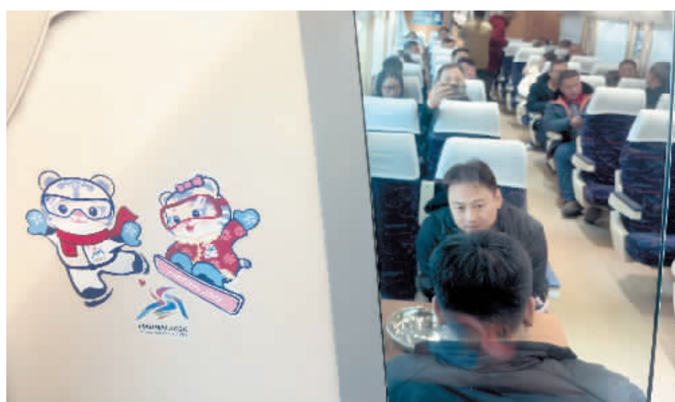
车厢内随处可见的亚冬会元素。

K5197次列车每日8时从哈尔滨站始发,10时15分抵达亚布力南站;17时25分从亚布力南站发车,19时40分返回哈尔滨站。“亚布力南站临近亚布力熊猫馆、滑雪旅游度假区、青云小镇,去哪儿都方便。”列车长张悦说。(下转第三版)