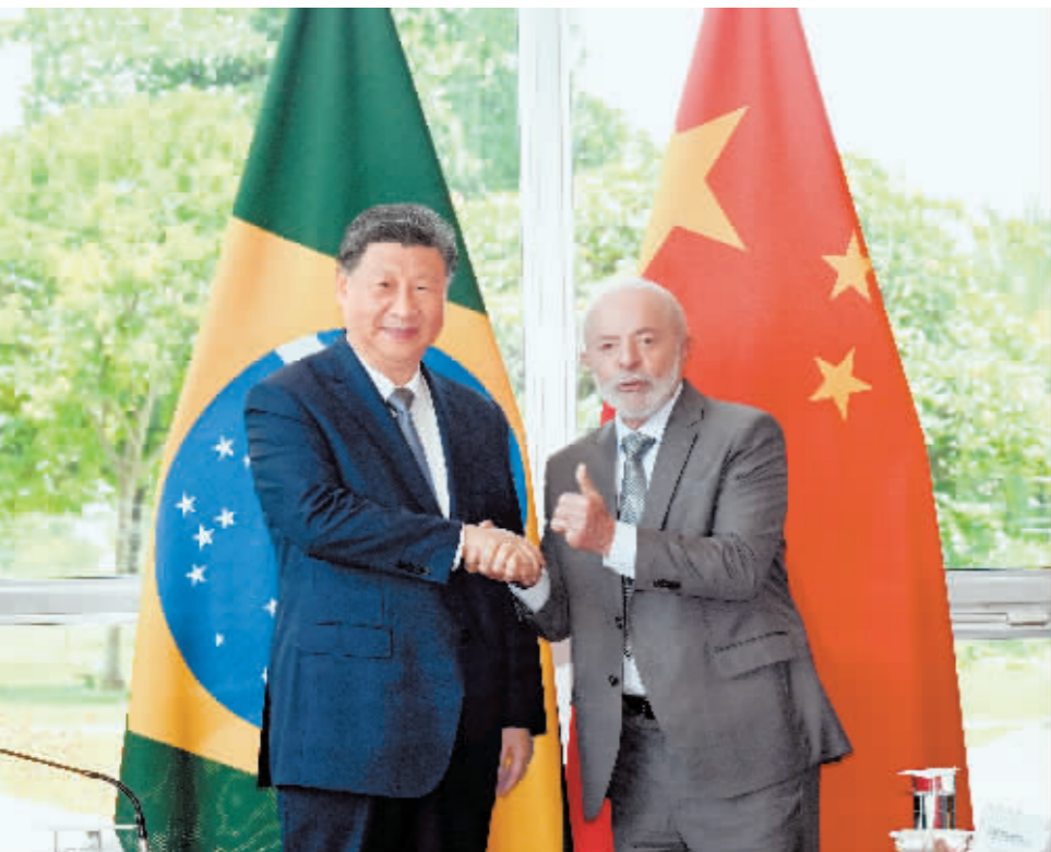
当地时间11月20日上午,国家主席习近平在巴西利亚总统官邸黎明宫同巴西总统卢拉举行会谈。