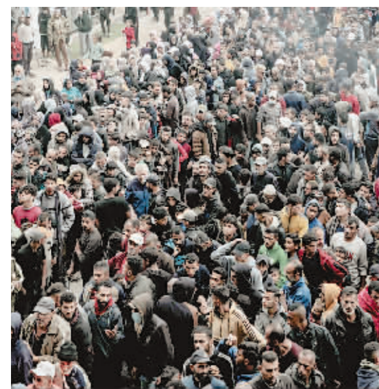
在加沙地带南部城市汗尤尼斯,巴勒斯坦人排队等待购买食物。加沙地带北部地区生活物资告急,人道主义危机愈演愈烈。

以色列总理本雅明·内塔尼亚胡19日视察以军部队时声称,加沙地带战事结束后,巴勒斯坦伊斯兰抵抗运动(哈马斯)将无法统治加沙,并在加沙不复存在。前一天,哈马斯宣布,在加沙南部打击抢掠人道主义援助物资的帮派,打死20名劫匪。以色列媒体认为,这显示哈马斯尽管遭到削弱,仍在对加沙实施管治。