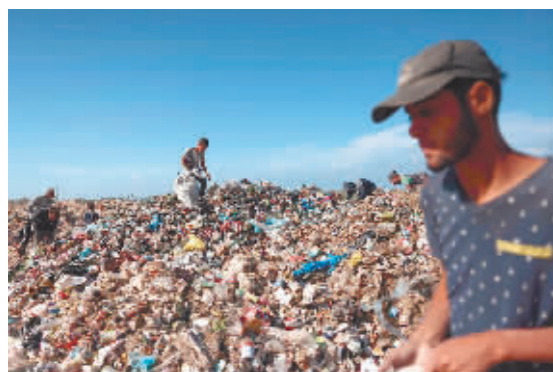
加沙民众在垃圾堆中搜寻物品。