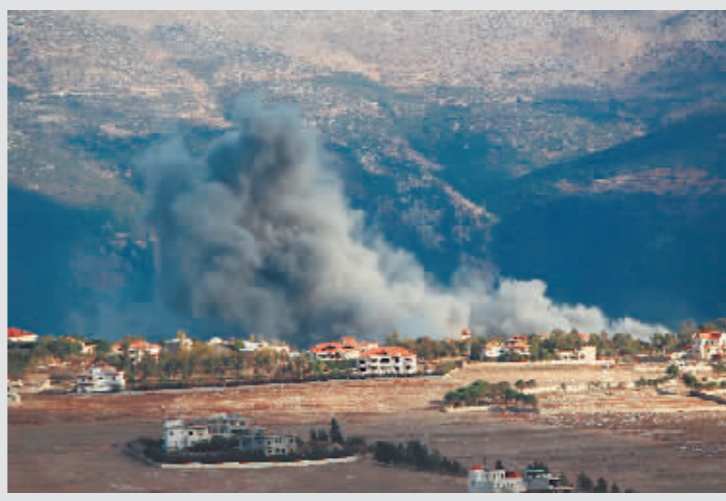
在黎巴嫩亚姆拍摄以军袭击后产生的浓烟。

间接谈判的同时,黎以冲突并无停歇迹象。以军继续空袭黎南部和首都贝鲁特南郊。以军说,真主党武装19日向以色列施放至少35枚发射物,其中一些被拦截。