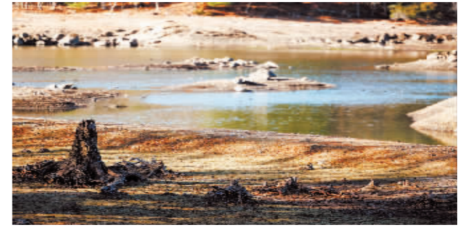
这是11月18日在美国马萨诸塞州皮博迪市拍摄的露出湖床的维诺纳湖水库。

从今年9月起,由于降雨量减少,包括马萨诸塞州在内的美国东北部许多地区经历了干旱天气,同时还面临野火的威胁。