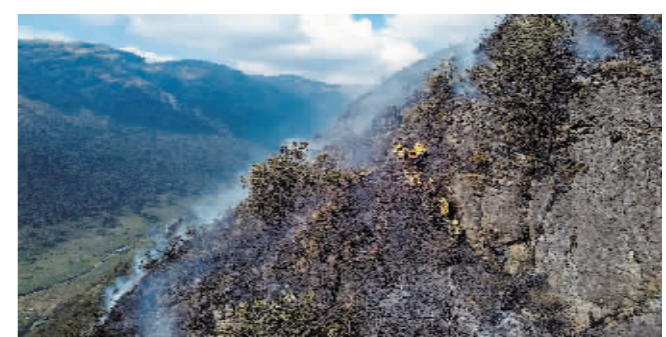
在厄瓜多尔昆卡,消防员进行灭火作业。

据新华社电 厄瓜多尔国家风险管理秘书处18日发表公报说,由于森林火灾、水资源短缺和干旱状况范围影响大,全国将进入为期60天的紧急状态。