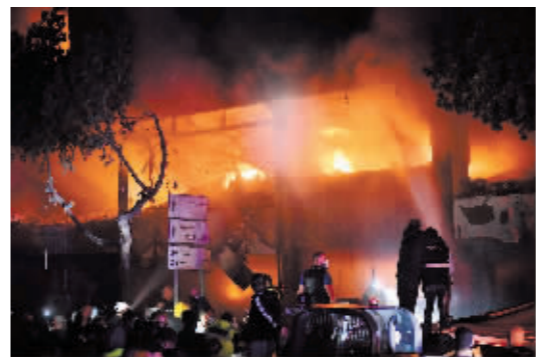
▲11月17日在黎巴嫩贝鲁特拍摄的以军袭击造成的火灾。