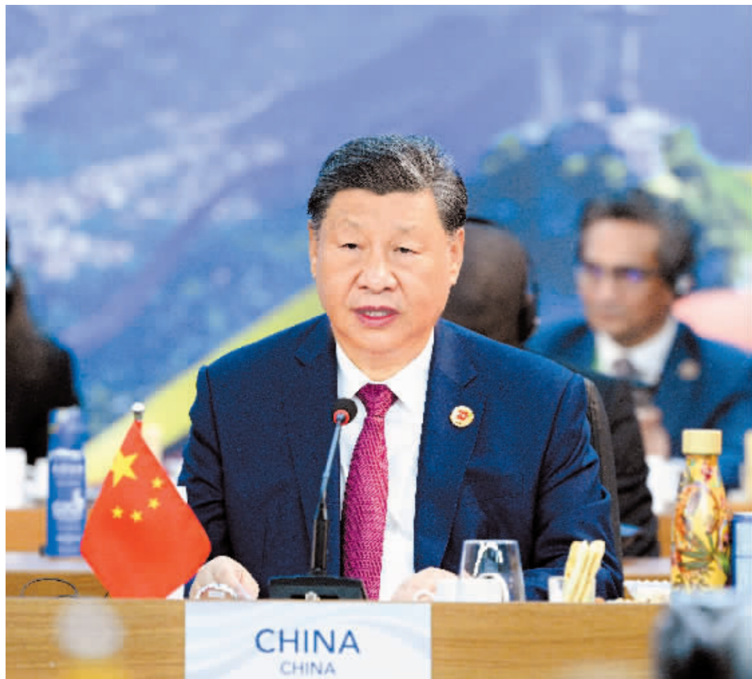
当地时间 11 月 18 日上午, 国家主席习近平在巴西里约热内卢出席二十国集团领导人第十九次峰会。在峰会第一阶段围绕“抗击饥饿与贫困”议题讨论时, 习近平发表题为《建设一个共同发展的公正世界》的重要讲话。