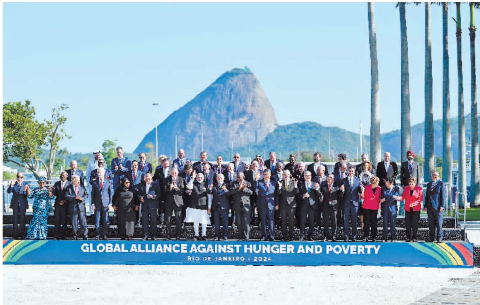
当地时间 11 月 18 日上午, 国家主席习近平在巴西里约热内卢出席二十国集团领导人第十九次峰会。峰会把“构建公正的世界和可持续的星球”作为主题, 并决定成立“抗击饥饿与贫困全球联盟”。这是习近平同与会领导人共同参加巴方发起的“抗击饥饿与贫困全球联盟”合影。

新华社里约热内卢 11 月 18 日电 (记者 倪 四义 姜岩) 当地时间 11 月 18 日上午, 国家主席习近平在巴西里约热内卢出席二十国集团领导人第十九次峰会。