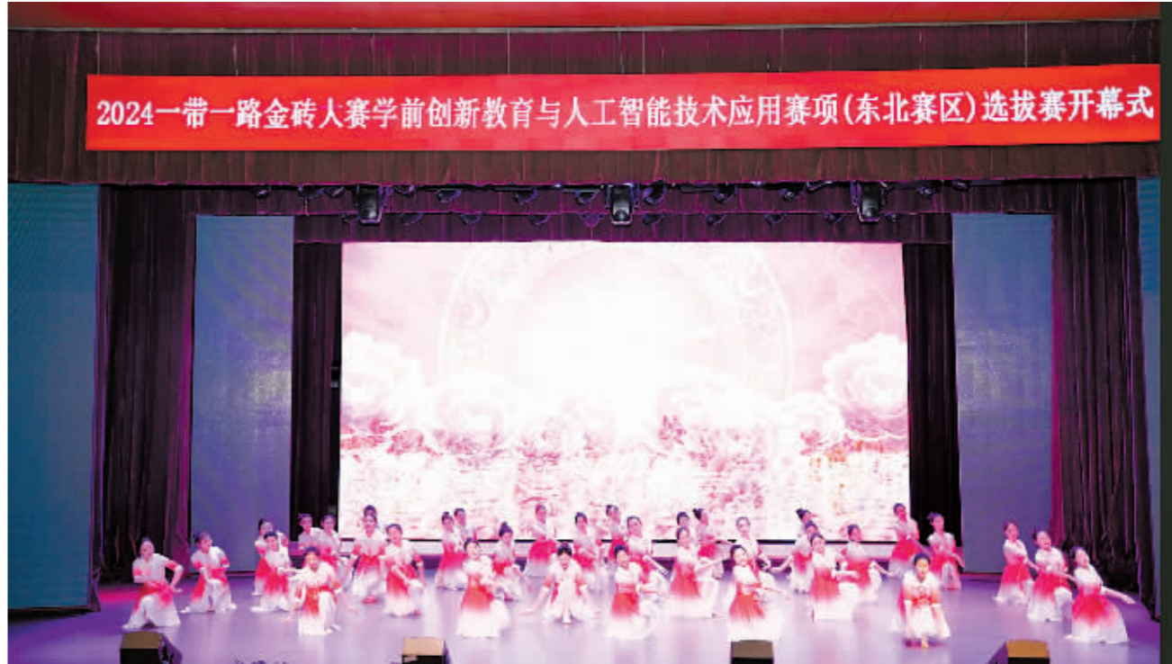
2024一带一路金砖人赛学前创新教育与人工智能技术应用赛项(东北赛区)选拔赛开幕式

大赛期间,同步举办了“人工智能+时代学前创新教育与创新型幼教人才培养高峰论坛”,特邀学前教育与学前教师教育领域知名专家学者同广大园长教师齐聚一堂,共同谋划新时代高质量推进学前创新教育与创新型幼教人才培养的新思路新举措。