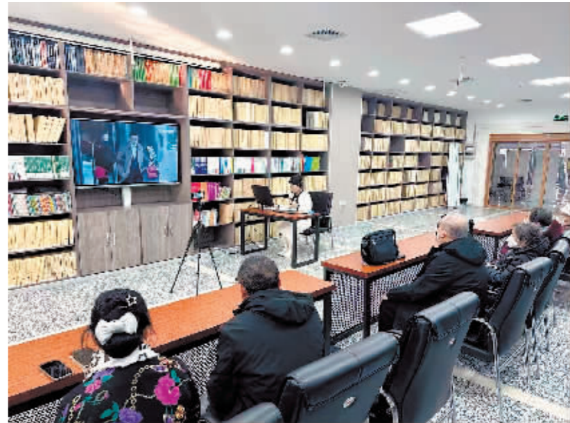
志愿者为视障爷爷奶奶讲述电影。

你是否知道有这样一群人,他们是童话里的“小王子”和“小公主”,孤独地生活在自己的“星球”上,活在自己的世界里,他们患有孤独症(又称自闭症),被称作“来自星星的孩子”。