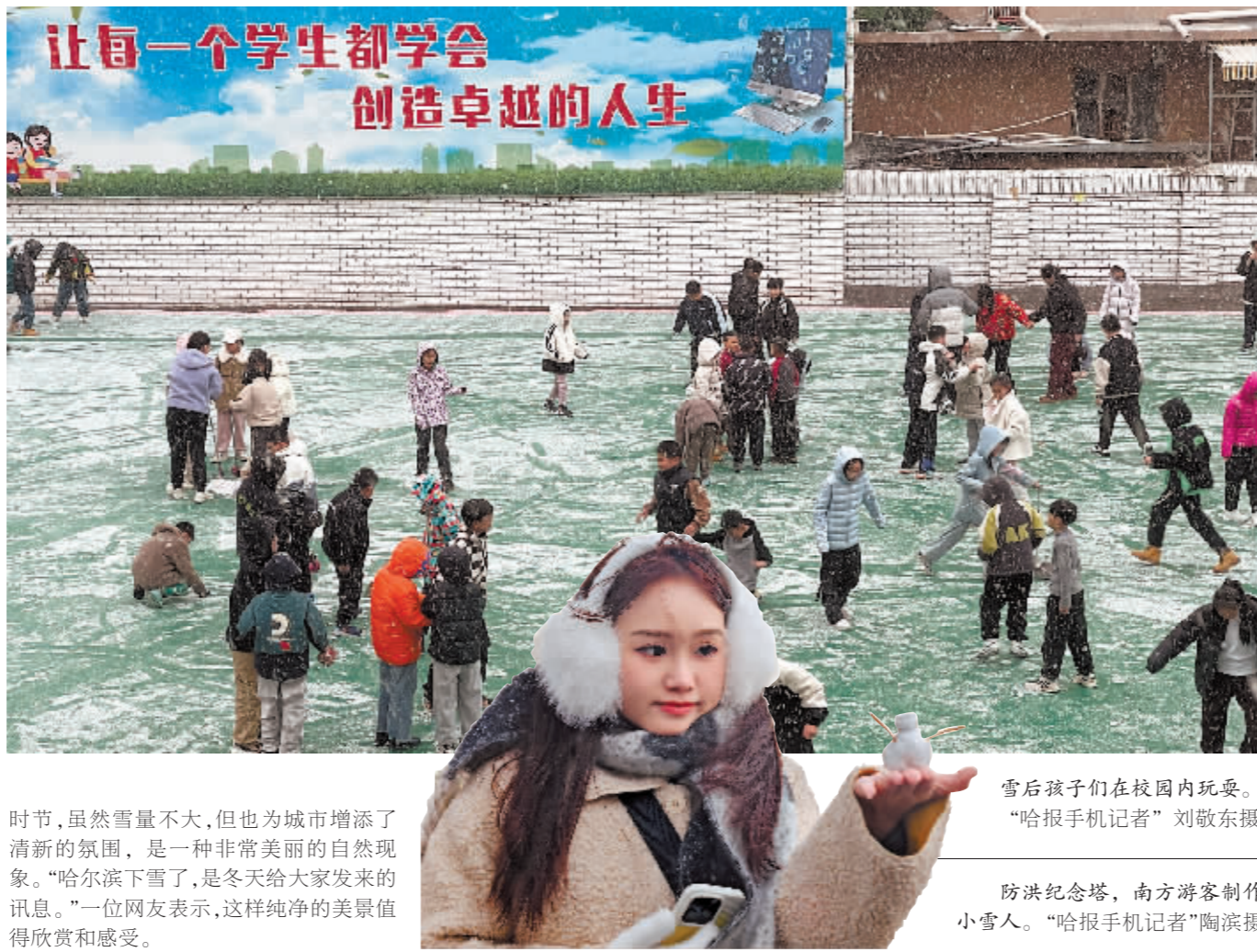
时节,虽然雪量不大,但也为城市增添了清新的氛围,是一种非常美丽的自然现象。“哈尔滨下雪了,是冬天给大家发来的讯息。”一位网友表示,这样纯净的美景值得欣赏和感受。