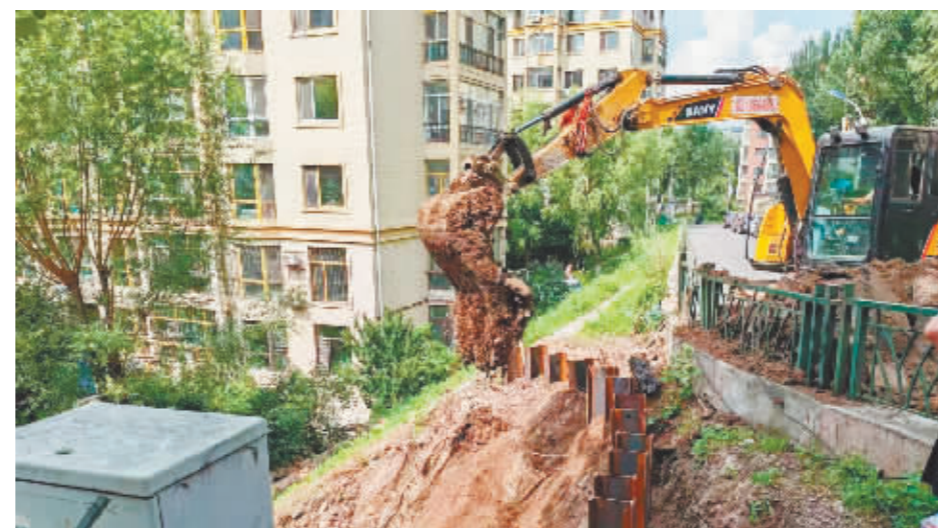
海富山水文园下水井抢修现场。

本报讯(实习生 覃棋棋 记者 刘述波)“幸亏及时应急启动了住房维修专项资金,修好了下水管和护坡,让我们不再担心楼体的安全了。”近日,香坊区海富山水文园A13栋的业主们高兴地说。记者从哈市住房专项维修资金服务中心获悉,今年以来,在该中心的全力推动下,通过应急启动专项维修资金,助力解决多个小区居民遇到的公共设施破损等急难愁盼问题。