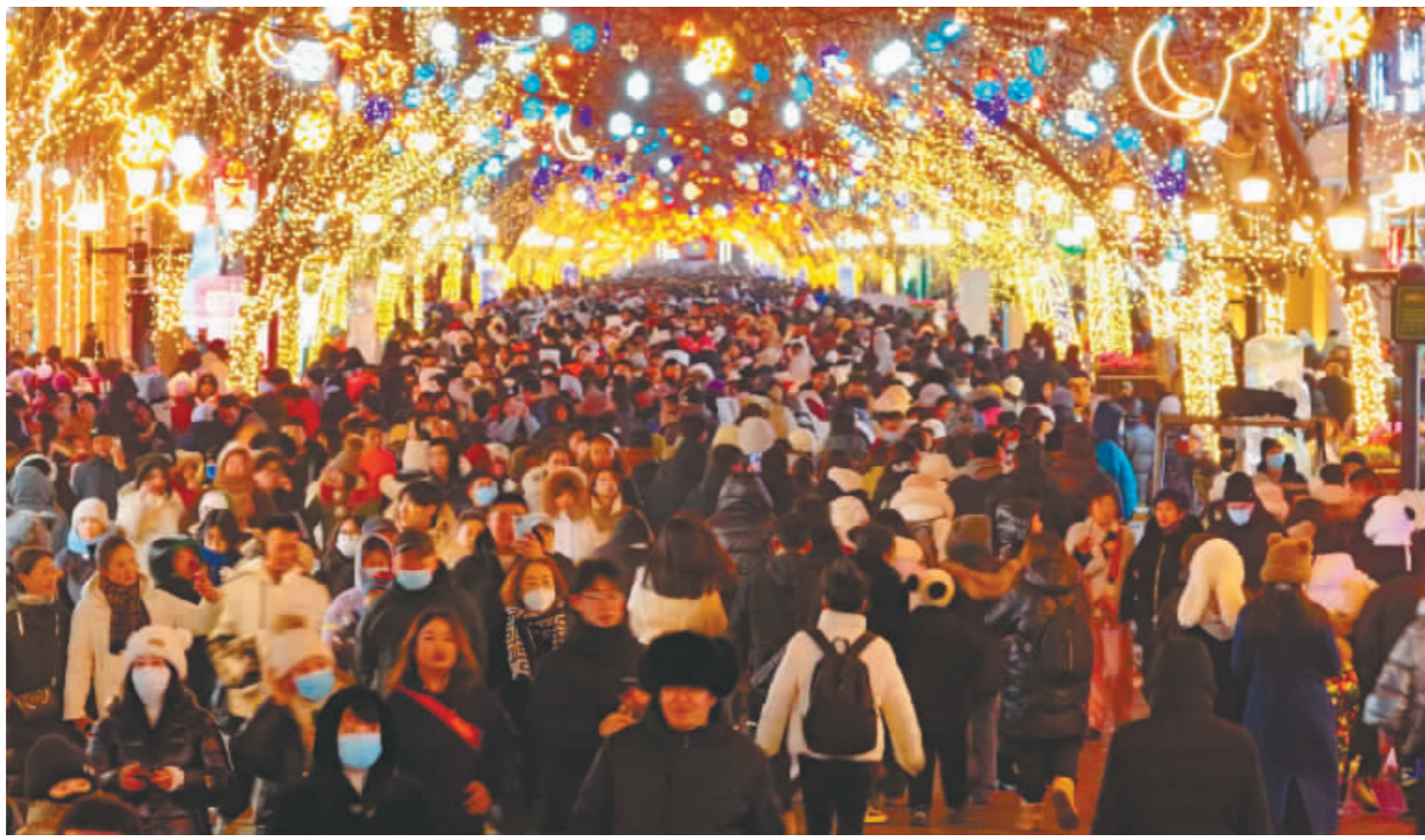
2023—2024年冰雪季期间,夜晚的中央大街灯火璀璨,游人如织。“哈报手机记者”傅强摄(资料片)

哈尔滨是文化底蕴深厚的国家历史文化名城、中国优秀旅游城市,被授予“世界音乐之城”“国际湿地城市”“奥运冠军之城”“东亚文化之都”称号。这里金源文化、欧陆文化、红色文化、音乐文化、冰雪文化、时尚文化等多元文化荟萃,中西文化交融,显示出深厚的文化积淀,驱动城市文旅融合发展