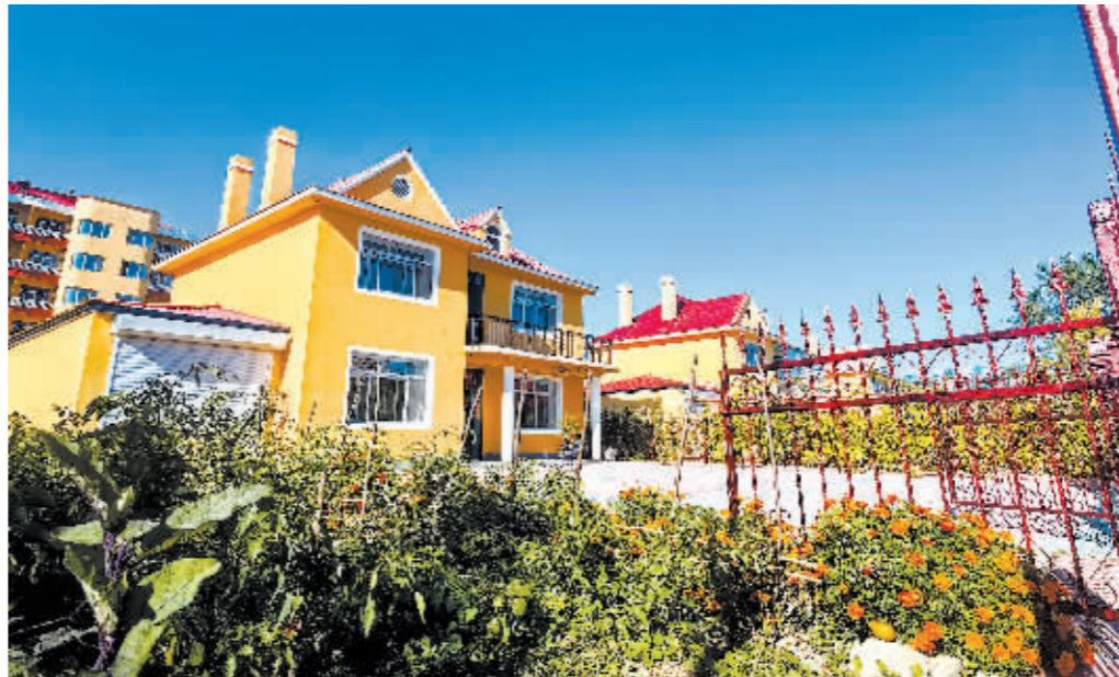
元宝村现代化的联排民居。

近年来,元宝村在大力发展工业的同时,做强生态农业,以文促旅、以旅兴农,还原“元茂屯”历史旧貌,打响“中国土改文化第一村”品牌,村集体经济持续发展壮大,村资产达7.4亿元,年人均纯收入4万元。今年,哈尔滨市在全省率先开展“百村示范、千村整治”宜居宜业和美乡村建设行动,为和美乡村赋能铸魂,创建五星级村15个、四星级村100个,看得见山水、留得住乡愁的和美乡村典型如雨后春笋般涌现。哈尔滨市农业农村局乡村建设处处长房跃轩对记者说:“美丽乡村与和美乡村一脉相承,一字之变,内涵深远,更加注重放大了原生态乡村魅力,致力留住乡村乡韵乡