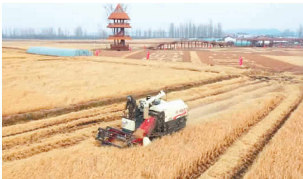
右图:水稻收割机在田间作业。

未来,龙王庙村将继续秉承“农业增效、农民增收”的发展理念,深入挖掘农业潜力,加强农业科技创新,推动稻米产业向高端化、品牌化方向发展。同时,积极探索农旅融合新模式,利用田园风光和农耕文化,吸引游客前来体验乡村生活,进一步拓宽乡村发展空间,让乡村振兴的蓝图在希望的田野上更加绚丽多彩。