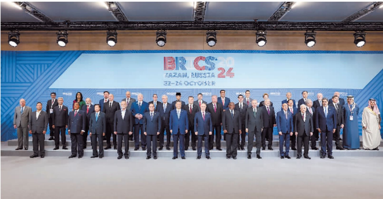
当地时间10月24日上午,国家主席习近平在喀山会展中心出席“金砖+”领导人对话会并发表题为《汇聚“全球南方”磅礴力量 共同推动构建人类命运共同体》的重要讲话。这是出席对话会的金砖国家及嘉宾国领导人或代表、国际组织负责人集体合影。