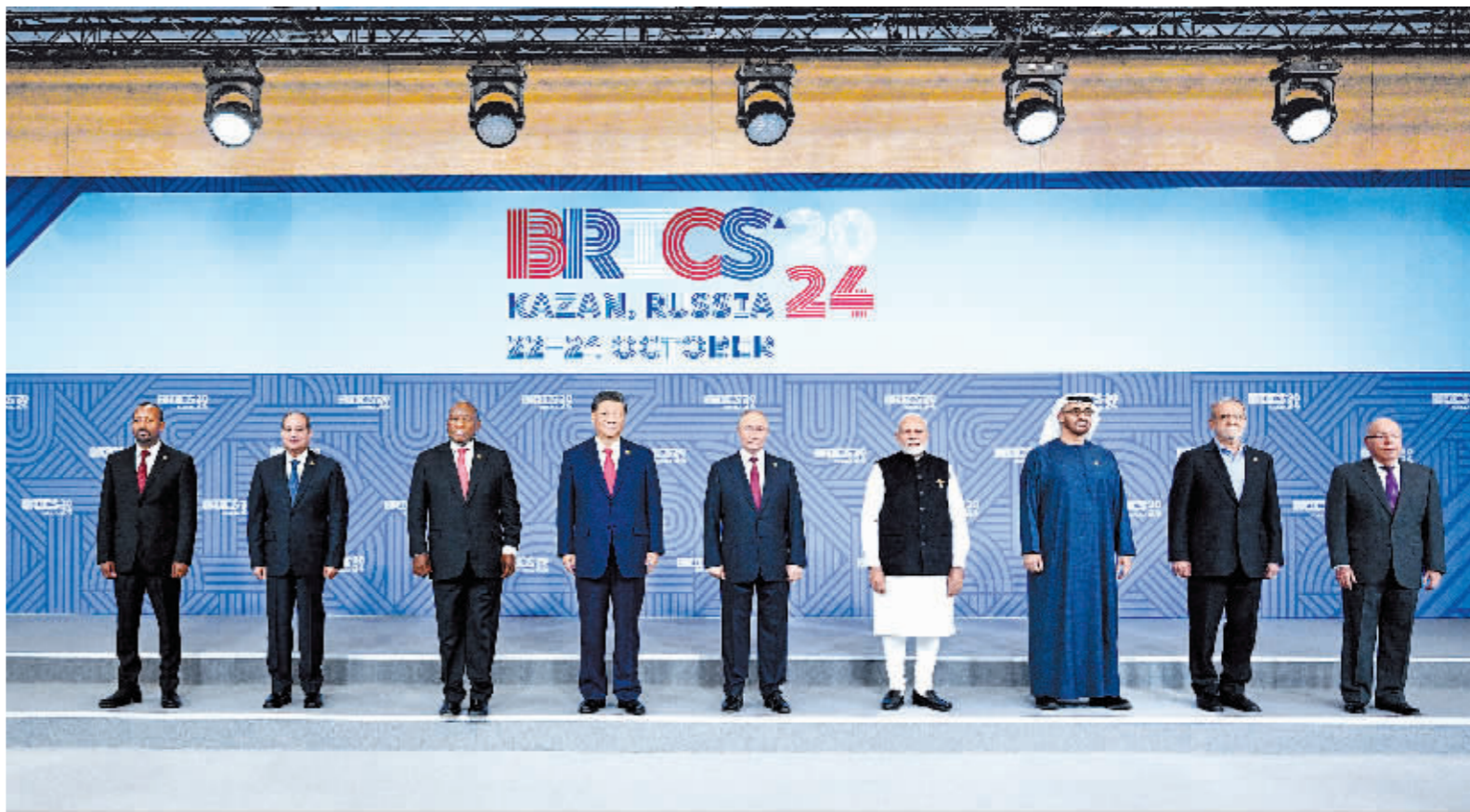
当地时间10月23日上午,金砖国家领导人第十六次会晤在喀山会展中心举行。俄罗斯总统普京主持会晤。中国国家主席习近平、巴西总统卢拉(线上)、埃及总统塞西、埃塞俄比亚总理阿比、印度总理莫迪、伊朗总统佩泽希齐扬、南非总统拉马福萨、阿联酋总统穆罕默德等出席。习近平发表重要讲话。