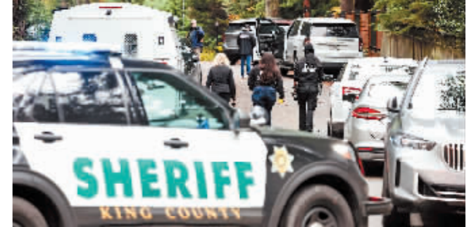
警察在枪击事件现场调查。

据新华社电 美国华盛顿州西雅图警方21日说,执法人员当天早晨在西雅图附近福尔城一处住宅中发现五人遭枪击身亡。一名未成年人已被逮捕。