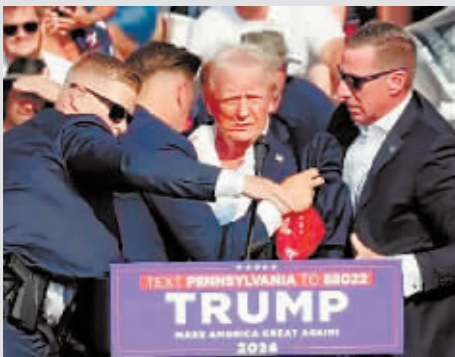
当地时间7月13日下午,特朗普在竞选集会发表演讲时遭枪击。

当地时间21日,美国国会众议院两党特别工作组发布的中期调查报告指出,7月13日针对前总统特朗普的暗杀未遂事件“本可以避免”,并揭示了联邦和地方执法机构在沟通和计划方面的缺陷。