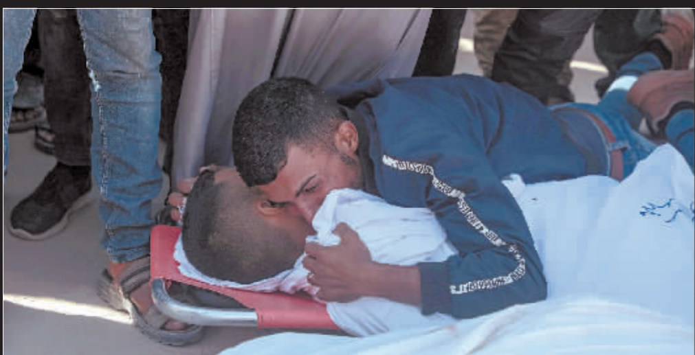
10月21日,在加沙地带南部城市汗尤尼斯的医院,一名男子为在冲突中遇难的亲人难过。