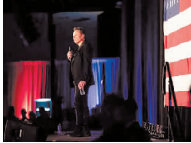
▲马斯克在竞选活动上为特朗普拉票。