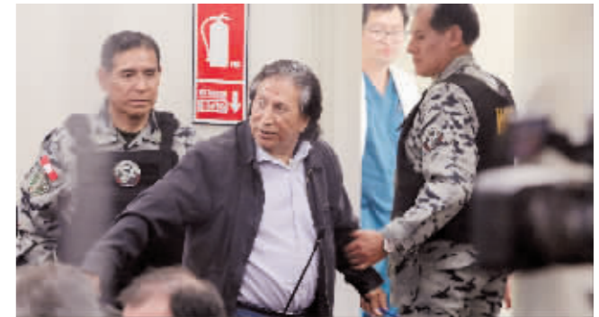
21日,法警护送托莱多(中)离开庭审现场。

据新华社电 秘鲁司法部门21日宣布,前总统亚历杭德罗·托莱多因严重腐败和洗钱被判处20年零6个月监禁。