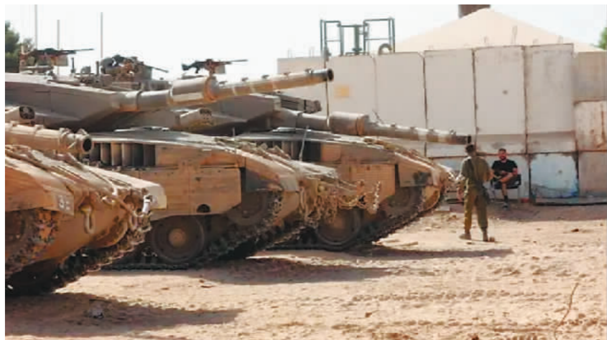
在以色列与加沙地带边境地区以方一侧拍摄的以军部队。

巴勒斯坦伊斯兰抵抗运动(哈马斯)下属武装卡桑旅10日说,当天在加沙地带北部伏击了一支以军车队,以军多人死伤。以军随后称三名预备役军人遇害身亡。