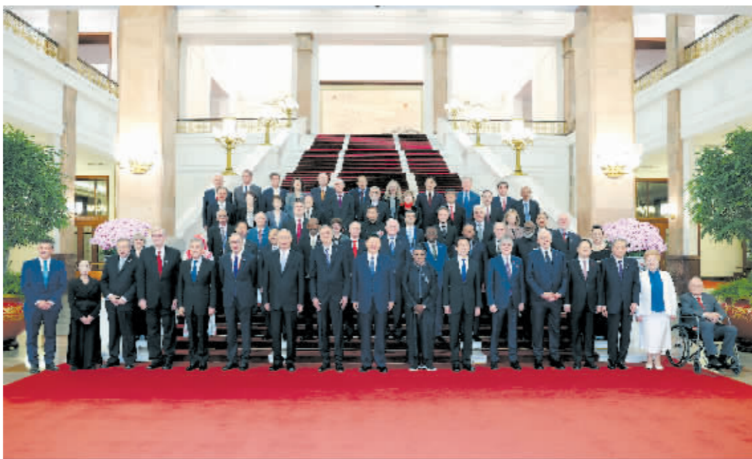
11日上午,国家主席习近平在北京人民大会堂集体会见出席中国国际友好大会暨中国人民对外友好协会成立70周年纪念活动的外方嘉宾。这是习近平同部分外方嘉宾代表合影留念。新华社记者 姚大伟摄

新华社北京10月11日电(记者孙奕 温馨)10月11日上午,国家主席习近平在北京人民大会堂集体会见出席中国国际友好大会暨中国人民对外友好协会成立70周年纪念活动的外方嘉宾。