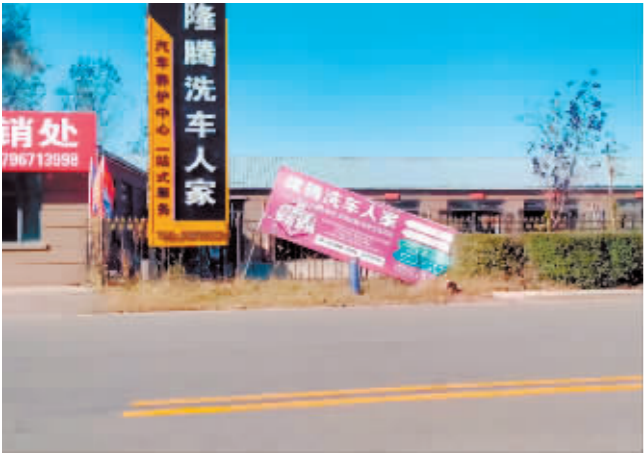
巴彦县通兴路24号门前牌匾倾斜。