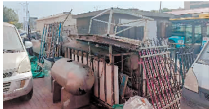
道外区先锋路与化工路交口电力箱体周围乱堆乱放。