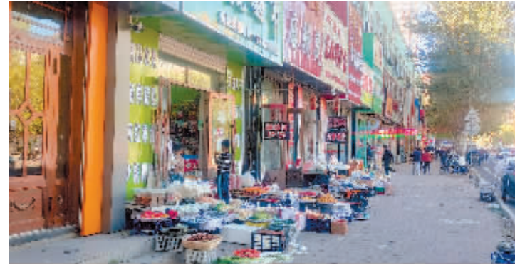
五常市文苑路332号店外经营。

根据相关部署,哈尔滨市各区县(市)政府要按照“大干50天”提升亚冬会城乡环境保障水平要求,压实亚冬会环境保障属地主体责任,加强行业督导,夯实街道和社区城市管理基础作用,强化城市管理网格“双街长”和“智慧网格系统”运行机制,强力推进各项工作任务落实,为亚冬会顺利举办提供坚强有力的城管保障。