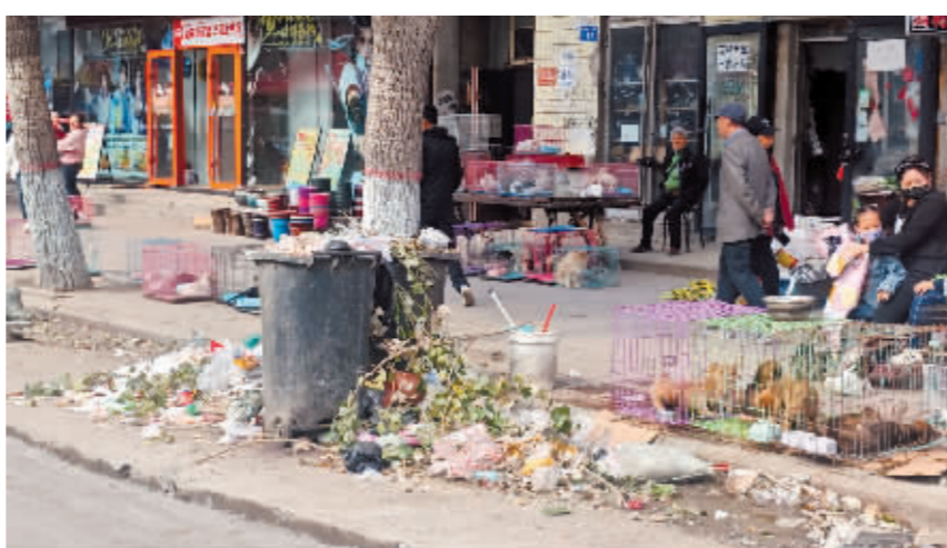
宾县宾州东大街108号垃圾桶周边垃圾乱堆,且人行道乱摆乱放。