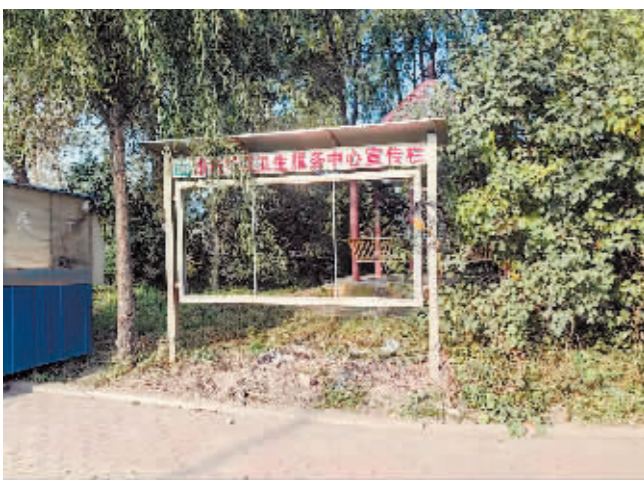
延寿县北城西路宣传牌破损。