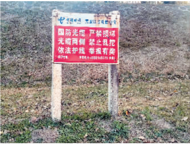
松北区中源大道电信警示牌锈蚀破损。