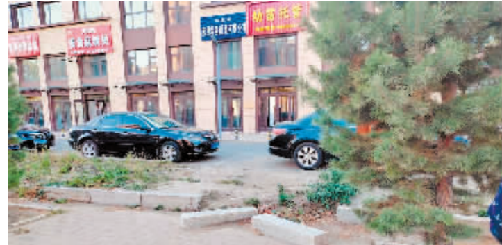
双城区聚源里小区边石破损。