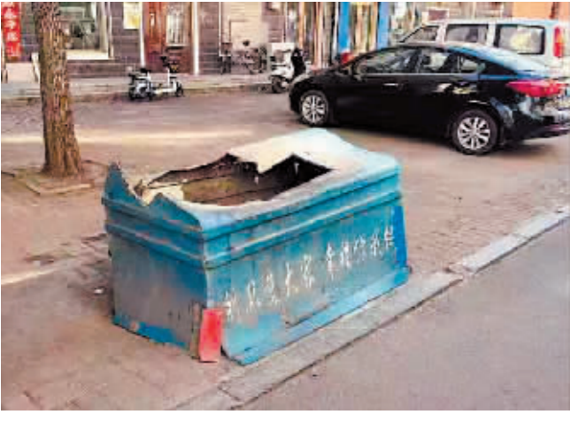
通河县百合街与榆树街交口垃圾箱破损。