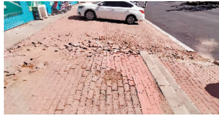
木兰县安平街178号人行道塌陷。