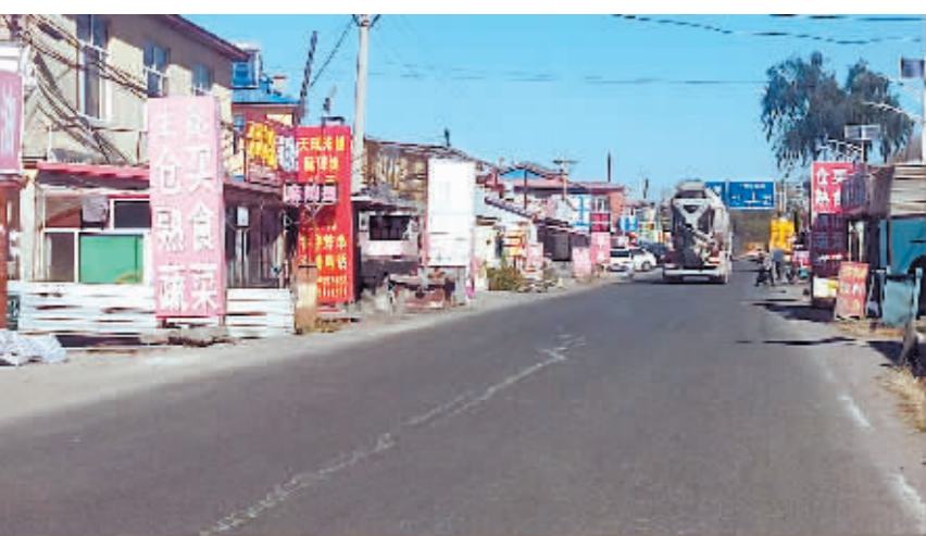
香坊区哈南路幸福村吕家油坊街面混乱。