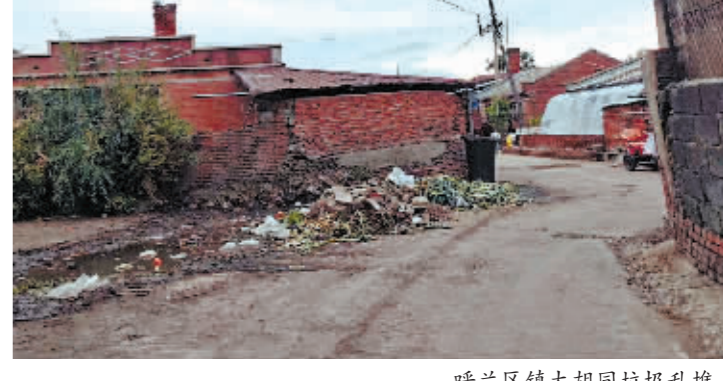
呼兰区镇太胡同垃圾乱堆。