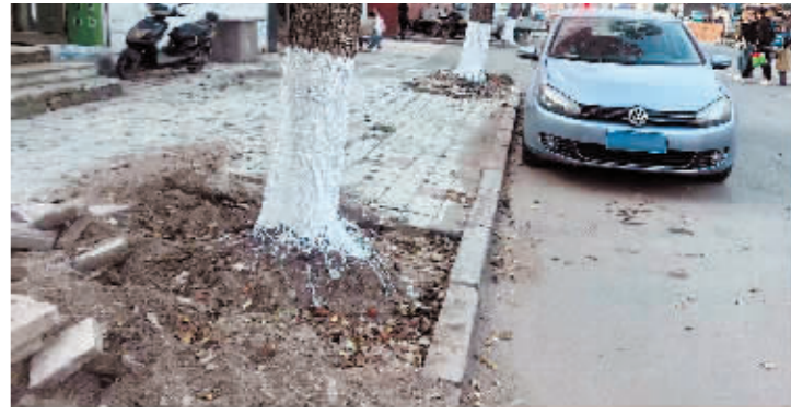
尚志市公安家属楼胡同树池子缺失。