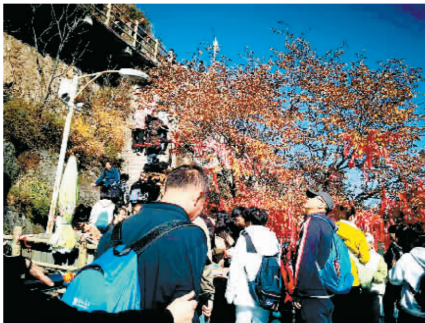
帽儿山景区内游人如织。

帽儿山景区内还设有多种旅游项目和设施,能满足游客的不同需求。游客们纷纷选择徒步或索道登山,沿途欣赏美丽的自然风光;或体验水滑梯等刺激项目,为登山之旅增添乐趣。