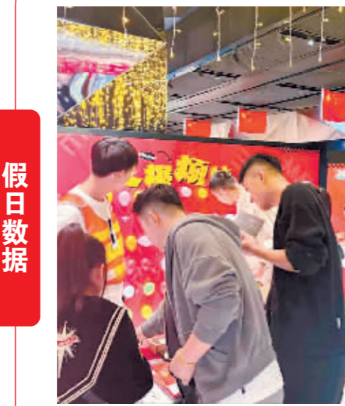
候场小游戏吸引观众参与。

国庆档明星扎堆,影片类型多样,哈市各家影院推出了各种活动。万达影城有早晚场优惠价观影;黄金海岸影城推出了99元三人观影加零食、饮料大礼包;艾美国际影城非常贴心,担心候场观众无聊,设置了“扎爆烦恼”小游戏,顾客凭票参与扎气球游戏可赢取电影票、爆米花和电影周边产品等奖品,现场反响热烈,候场区内一片欢声笑语。