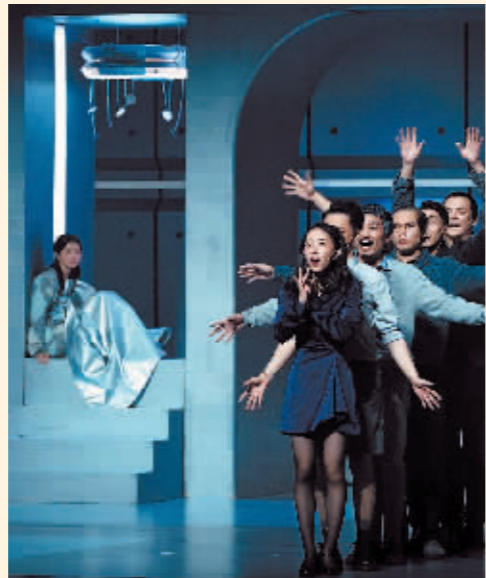
超越青春版话剧剧照。