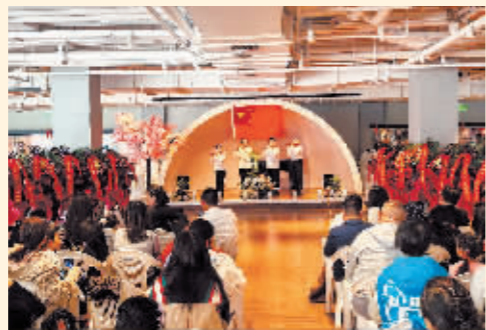
竹笛演奏精彩纷呈。