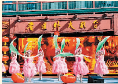
中华巴洛克历史文化街区文艺演出。