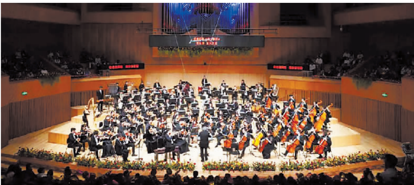
交响乐团精彩演出。

本报讯(记者 于秋莹)城市上空传来动听的旋律,众多艺术家齐聚“冰城”,用高雅演出表达对共和国的无限热爱和美好祝愿。10月1日,哈尔滨举办涵盖文艺演出、文化市集等主题在内的多项活动,更好满足市场需求,丰富广大市民游客的节日生活。