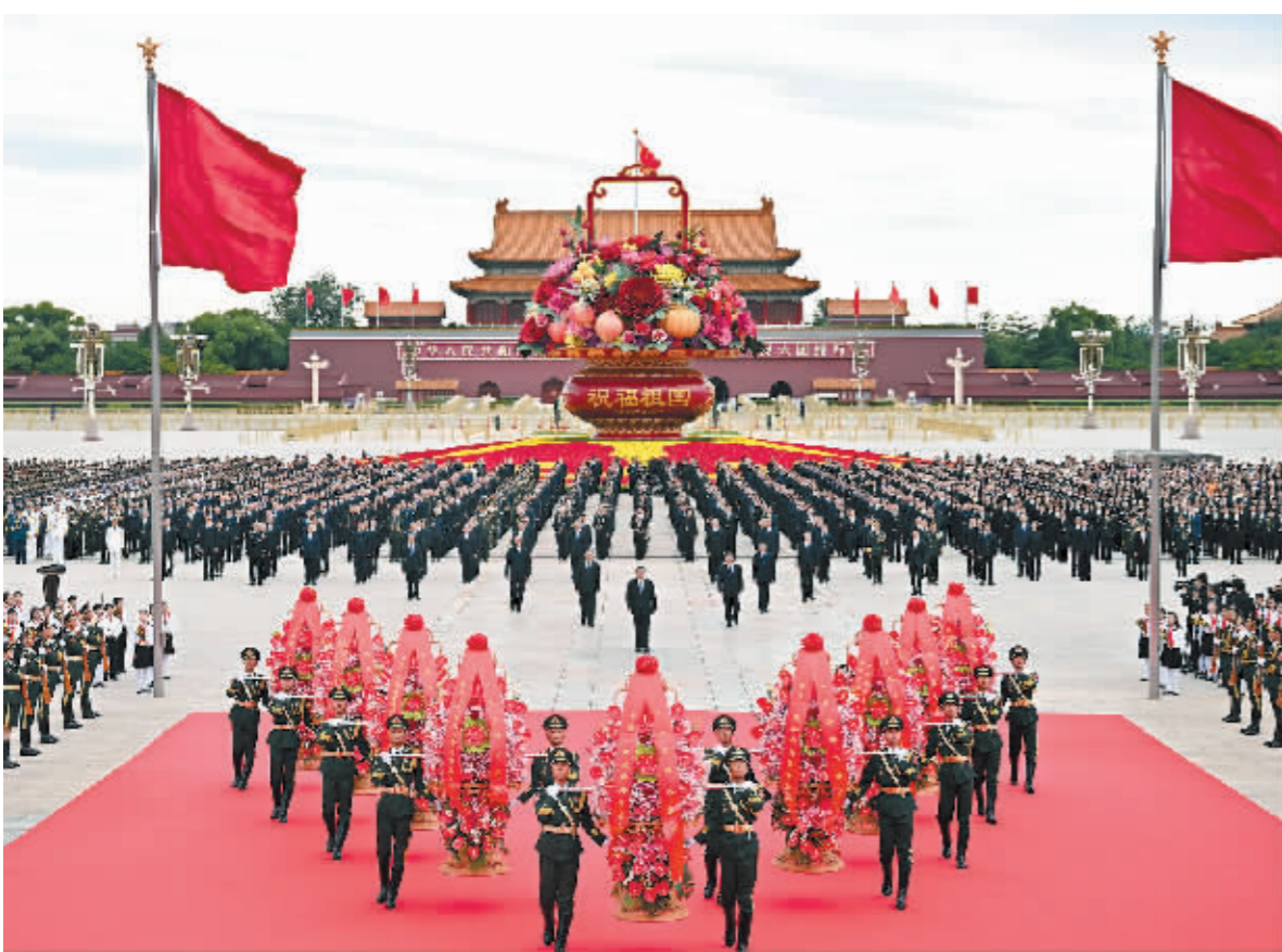
韩正等来到北京天安门广场,出席烈士纪念日向人民英雄敬献花篮仪式。这

新华社北京9月30日电 在庆祝中华人民共和国成立75周年之际,烈士纪念日向人民英雄敬献花篮仪式30日上午在北京天安门广场隆重举行。党和国家领导人习近平、李强、赵乐际、王沪宁、蔡奇、丁薛祥、李希、韩正等,同各界代表一起出席仪式。 广阔的天安门广场上,鲜艳的五星红旗迎风招展。广场中央,“祝福祖国”巨型花篮表达着对祖国繁荣昌盛的美好祝福。巍然耸立的人民英雄纪念碑北侧,两组花坛上镶嵌着白菊等鲜花组成的18个花环,寄托着全体中华儿女对英烈的深切缅怀。