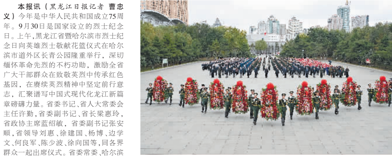
9月30日,黑龙江省暨哈尔滨市烈士纪念日向英雄烈士敬献花篮仪式在哈尔滨市道外区长青公园隆重举行。

本报(黑龙江日报记者 曹忠义)今年是中华人民共和国成立75周年。9月30日是国家设立的烈士纪念日。上午,黑龙江省暨哈尔滨市烈士纪念日向英雄烈士敬献花篮仪式在哈尔滨市道外区长青公园隆重举行,深切缅怀革命先烈的不朽功勋,激励全省广大干部群众在致敬英烈中传承红色基因,在赓续英烈精神中坚定前行意志,汇聚谱写中国式现代化龙江新篇章磅礴力量。省委书记、省人大常委会主任许勤,省委副书记、省长梁惠玲,省政协主席蓝绍敏,省委副书记张安顺,省领导刘惠、徐建国、杨博、边学文、何良军、陈少波、徐向国等,同各界群众一起出席仪式。省委常委、哈尔滨市委书记于洪涛主持仪式。 长青公园苍松挺立、翠柏环抱,东北抗日暨爱国自卫战争烈士纪念馆巍然耸立。 8时30分许,黑龙江省暨哈尔滨市烈士纪念日向英雄烈士敬献花篮仪式正式开始。 伴随着雄浑高亢的《义勇军进行曲》,全场齐声高唱中华人民共和国国歌。 国歌唱毕,全场肃立,向中国人民解放军事业和共和国建设事业英勇献身的烈士默哀。 默哀毕,少先队员献唱《我们是共产主义接班人》,并致少年先锋队队礼。 方阵前,以省委、省人大常委会,省政府,省政协,驻省各部队,各民主党派、工商联和无党派人士,各人民团体和省及哈尔滨市各界群众,老同志、老战士和烈士亲属,少先队员名义敬献的9个大型花篮一字排开,花篮的红色缎带上书写着“英雄烈士永垂不朽”。 《献花曲》响起,18名礼兵稳稳抬起花篮,拾阶而上,将花篮整齐摆放到纪念碑基座上。 许勤缓步上前,仔细整理花篮缎带。随后,许勤、梁惠玲等省领导及各界代表缓步绕行,瞻仰烈士纪念馆,表达对英雄烈士的深切追思和崇高敬意。 参加敬献花篮仪式的还有,省人大常委会、省政府、省政协领导同志,省法院院长,省军区、驻省解放军和武警部队负责同志,哈尔滨市负责同志,解放军和武警官兵代表,老干部、老战士、烈士亲属和先优模范代表,退役军人代表,社会各界代表,少先队员代表等。