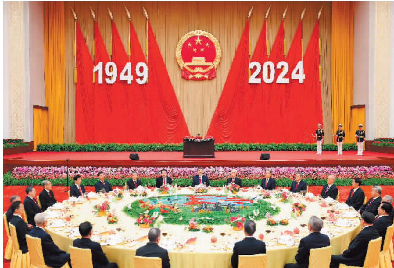
9月30日晚,庆祝中华人民共和国成立75周年招待会在北京人民大会堂隆重举行。习近平、李强、赵乐际、王沪宁、蔡奇、丁薛祥、李希、韩正等党和国家领导人与约3000名中外人士欢聚一堂,共庆新中国75周年华诞。

新华社北京9月30日电 庆祝中华人民共和国成立75周年招待会30日晚在人民大会堂隆重举行。中共中央总书记、国家主席、中央军委主席习近平出席招待会并发表重要讲话。他强调,中华人民共和国成立75年来,我们党团结带领全国各族人民不懈奋斗,创造了经济快速发展和社会长期稳定两大奇迹,中国发生沧海桑田的巨大变化,中华民族伟大复兴进入了不可逆转的历史进程。新时代新征程,中国人民必将创造出新的更大辉煌,必将为人类和平和发展的崇高事业作出新的更大贡献。