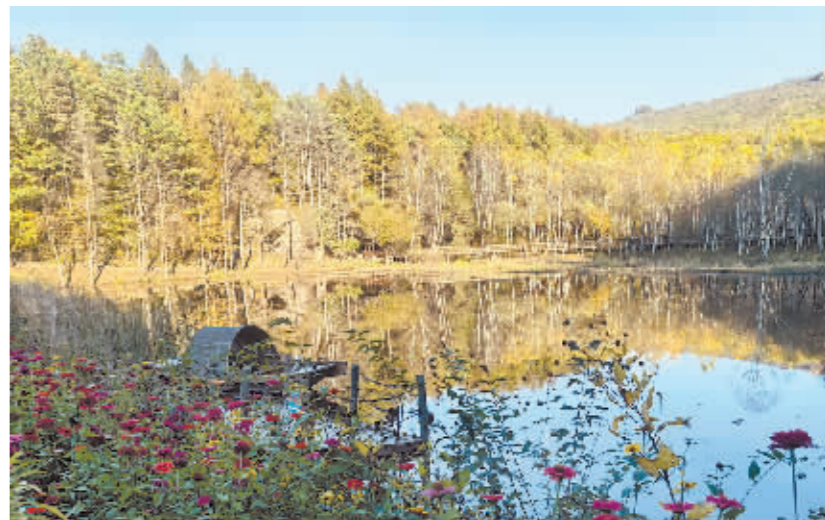
松峰山景区宛如仙境。

松峰山作为黑龙江省青少年自然教育绿色营地,就像一本天然的“动植物百科全书”,598种高等植物、数十种国家级重点保护植物,315种野生动物、200余种鸟类及重点保护动物等你认识。在这座极其鲜活的自然教育课堂中,有耐寒的胡桃桃、极具药用价值的黄菠萝树,经历千年才能形成的天然植物“活化石”塔头墩……游客可以和遛