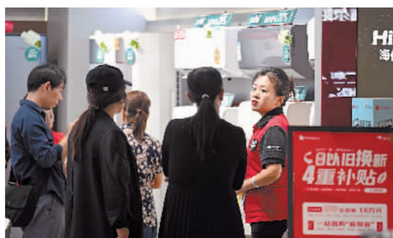
在天津一商店内工作人员向顾客讲解产品。

月份全国乘用车零售量为190.5万辆,环比增长10.8%。家用电器和音像器材类零售额由降转升,8月份