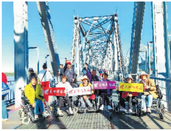
无障碍旅游团打卡中东铁路桥。