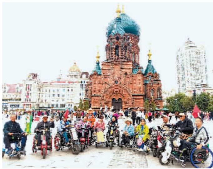
无障碍旅游团在建筑艺术广场合影。