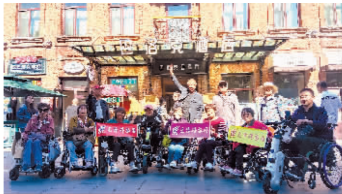
无障碍旅游团在下榻的酒店门前合影。