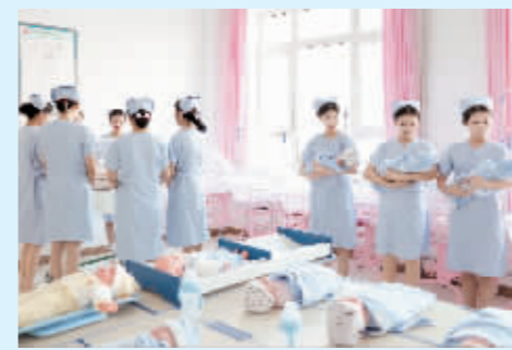
中职学校护理专业课堂。