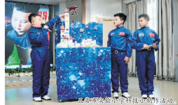
五常市实验小学科技小制作活动。