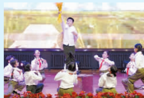
哈尔滨市德育工作现场会上党史故事表演。