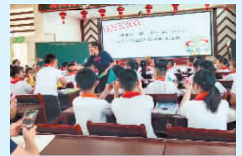
结对帮扶名师示范课。