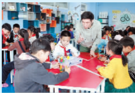
创课教师开展拓展型课程机器人搭建。

积极推进特殊教育优质融合发展,我市20万人口以上的区、县(市)均建有特殊教育学校。对能适应普通学校学习生活、接受普通教育的适龄残疾学生优先随班就读,就近入学、应收尽收,适龄残疾儿童义务教育安置率100%。