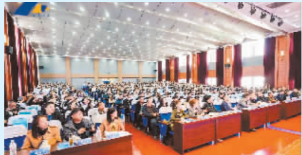
2024年高考备考专题研讨会。