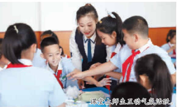
课堂上师生互动气氛活跃。