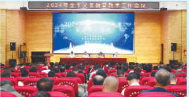
2024年全市义务教育教学工作会议。