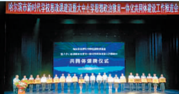
哈尔滨市新时代学校思政建设暨大中小学思想政治教育一体化共同体建设工作推进会。

全市教师队伍建设的“一号工程”。采取正面引领与刚性约束相结合,近3年选树“四有”好老师、好校长近5500人,组建100名由人大代表、政协委员组成的市级师德师风监督员队伍,强化师德约束。与此同时,加强教师队伍人才补充和交流。通过丁香人才周、公费师范生等方式多措并举持续加大教师招聘力度,优先保障紧缺学科教师补充,推进“县管校聘”改革,2023年度共计交流校长184人、交流教师2540人,有效解决了教师结构性缺员问题。建立中小学教师培训学分管理平台,启动结对帮扶教师培训项目,采取“请上来、送下去、网起来”混合式的农村教师培训模式,涵盖33个学科,每年培训1万余人次。抓好全市教师队伍梯队建设,每年组织新教师培训,提升青年教师思想政治素质、师德师风水平和教育教学能力,引导其扣好职业生涯“第一粒扣子”。典型的力量有如接天莲叶无穷碧,在全市教育系统形成了一池荷花满城香的效果。