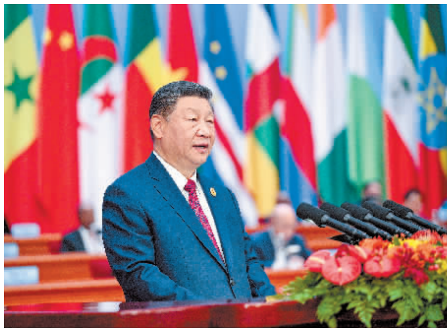
9月5日上午,国家主席习近平在北京人民大会堂出席中非合作论坛北京峰会开幕式并发表题为《携手推进现代化,共筑命运共同体》的主旨讲话。