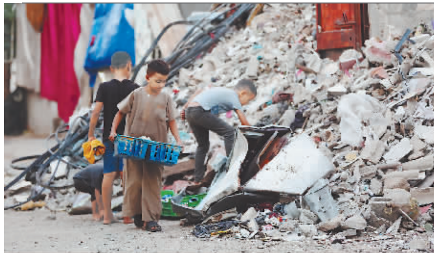
孩子们在加沙地带中部努塞赖特难民营的一处建筑废墟搜寻物品。