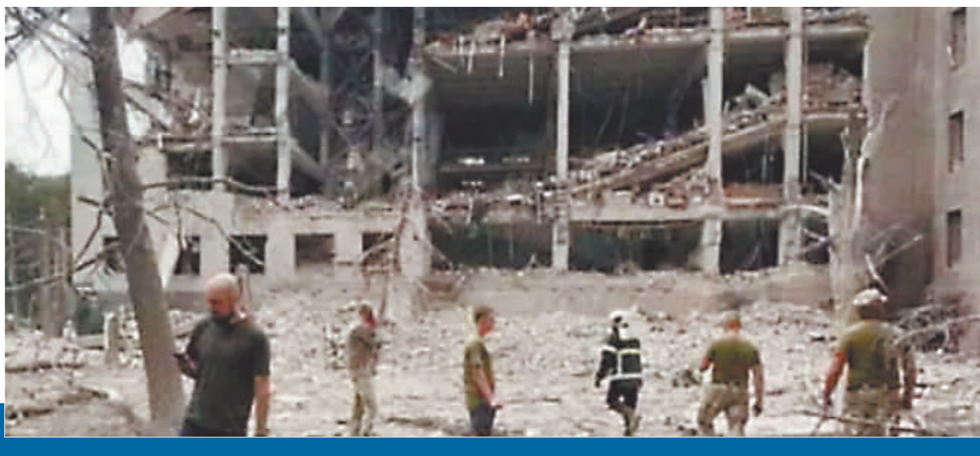
乌克兰遭到袭击的建筑。

同在3日,乌克兰多名官员递交辞呈,泽连斯基所属政党一名资深议员表示,政府将进行大幅人事调整,超半数部长可能易人。4日最新消息显示,乌克兰外交部长德米特里·库列巴已递交辞呈。