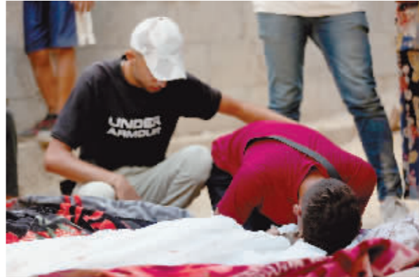
▲在加沙地带中部努塞赖特难民营，人们悼念在以军事轰炸中死亡的亲友。