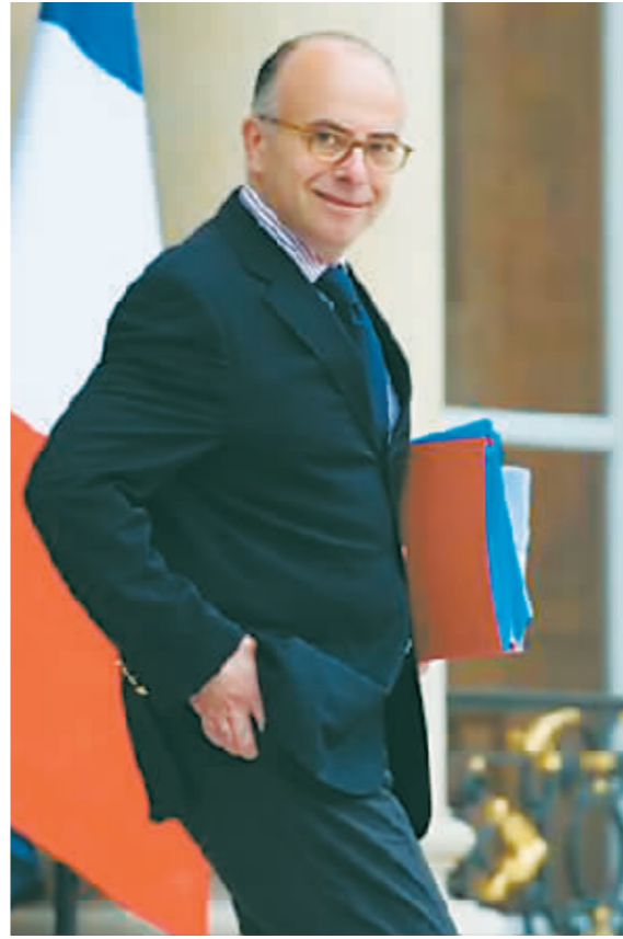
法国前总理贝尔纳·卡泽纳夫。

以马克龙领导的复兴党为首，中间派联盟“在一起”在6月欧洲议会选举中输给极右翼国民联盟。马克龙随后宣布解散国民议会、提前选举。 6月底至7月上旬国民议会选举中，左翼政党联盟“新人民阵线”在577个席位的国民议会中赢得180多席，位列第一，但未过半，需与其他政党联合组建政府，才能确保其推举的总理人选以及后续政策在议会顺利通关。“在一起”议席数量排第二，国民联盟及与之结盟的少数共和党盟友排第三。 国民议会选举过去近两个月，由于各政党团体难以弥合彼此政治立场分歧，新政府迟迟无法完成组建。马克龙8月26日晚发表声明，称他不会任命一个由“新人民阵线”领导的政府，理由是其执政将威胁法国的“体制稳定性”。 按路透社说法，新总理上任后面临推动改革举措和2025财年年度预算获国民议会审批通过的艰巨任务。 欧洲联盟委员会和债券市场正在施压法国削减赤字。依据法国宪法，即便法国的政治僵局在新政府就职后持续，马克龙也要到明年7月才有权解散议会、重新选举。