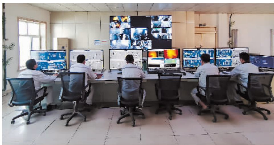
在中央控制室,技术人员通过电脑查看、操控设备。

今年年初,“宾州水泥”产值同比下降28.9%,增收收窄33.3个百分点。各级政府帮忙出主意、想办法,鼓励“宾州水泥”进行技术改造升级。(下转第五版)