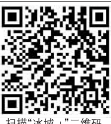
扫描“冰城+”二维码 观看赛事介绍