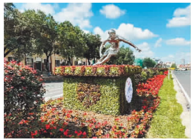
雕塑景观展现冰雪运动魅力。

本报讯(方爽 记者 梁可心)近日,一组充满活力、青春气息的运动雕塑亮相南岗区红军街,吸引路人驻足观看。这组雕塑以速滑、花滑、冰球、滑雪等冬季冰雪体育项目的动感瞬间为灵感源泉,形态各异、生动传神,不仅传递了亚冬会的信息,更营造出喜迎亚冬盛会的热烈氛围。