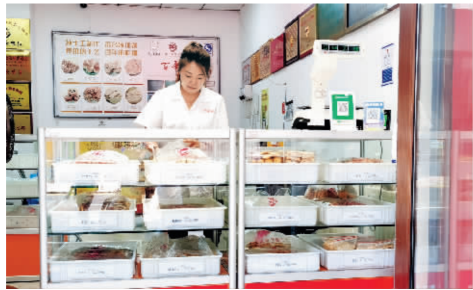
“非遗技艺”传统糕点很受外地游客青睐。

1966年到1986年,“胜利糕点”产品辐射东北三省,年产糕点700万斤,1986年的销售