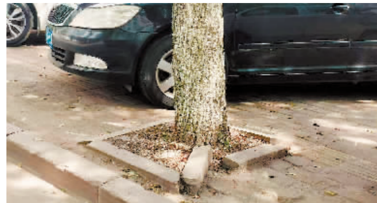
尚志市一曼街 55 号树池边石破损。

本报讯(记者 霍亮)今年以来,哈市以迎接亚冬会为牵动,坚持高标准设计、高质量建设、高水平管理,市、区园林部门积极推进绿化建设,打造有特色、高标准、高质量的园林绿化景观,持续改善人居环境。同时,哈市还通过持续督导检查,加强对园林问题点位和责任单位进行曝光晾晒,深入推进城乡环境秩序整治向纵深发展,提升城市园林环境品质。 市园林绿化中心所有干部组成专项检查组下沉一线,强化问题检查和督导整改落实。持续不间断对全市九区街路、公园及亚冬会涉及街路、城市节点、比赛场馆和宾馆住地周边,并辐射三环以内城区范围,进行徒步督导检查。建立问题台账,即时转办各区责任部门,要求 48 小时内整改、反馈,不能立即整改的列入整改计划,跟踪反馈并将此项工作列入考核。同时,充分利用智网系统,通过“网格化+智能化”强化各区自检自查工作效能。现对检查中发现的问题点位和责任单位进行曝光。 检查中发现,各区、县(市)背街背巷精细化管理程度明显落后于主要街路,园林化管理水平仍有待提升。主要存在以下问题:一是背街背巷养护管理作业不标准,树木枯枝、折断枝、病虫枝未修剪,枯死树未伐除;二是行道树仍存在枯死树,树木空坑未及时封闭;三是树木枯枝、萌芽修剪不到位;四是园林栅栏、绿地挡墙、树池边石等设施破损未及时维修;五是绿地内树根、树桩未及时清除,枯枝未及时清理;六是草坪、地被未按时除杂。 下一步,市园林中心将加强督导检查力度,围绕“标准再提升、范围再扩大、管理再深入、作业再精细”,要求各区、县(市)加大自检自查力度,重点做好薄弱环节、背街背巷的清理整治工作,推进破损园林设施的维修、树木修剪等工作,提升园林绿化精细化管理水平。