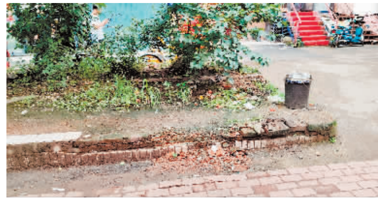
道外区育民街 32 号绿地杂乱、挡墙破损。