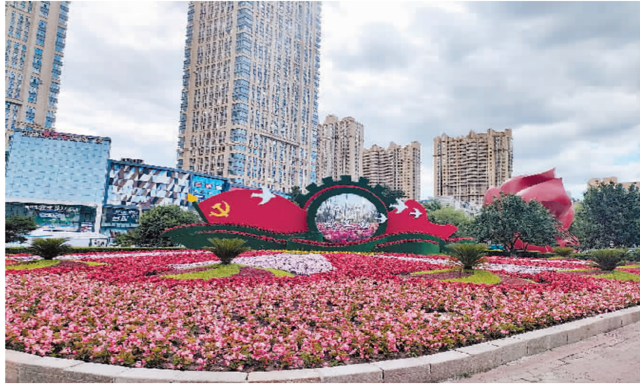
香坊区动力广场彩化。