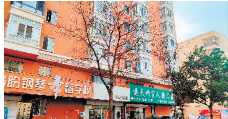
呼兰区建设南路盼盼舞蹈学校门前枯死树。