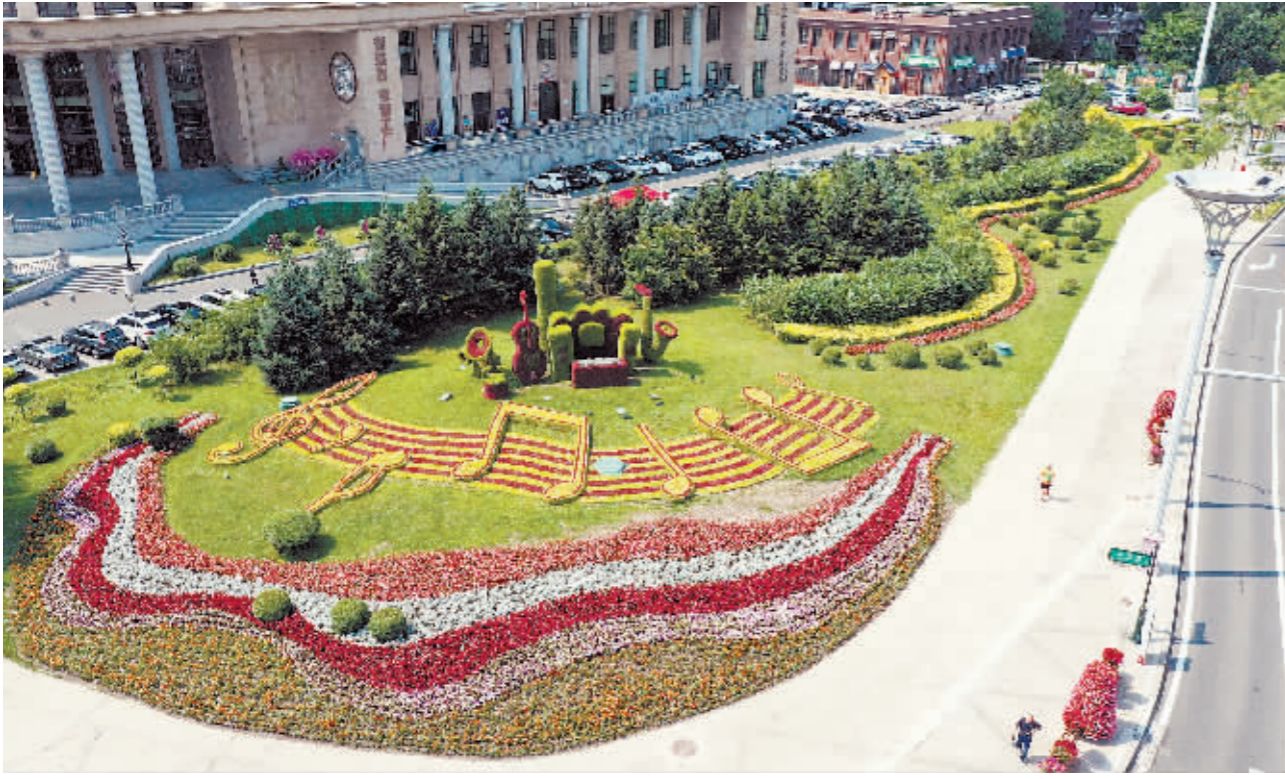
道里区友谊西路绿化景观。