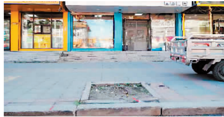
双城区花园大街行道树空坑树根未清理。