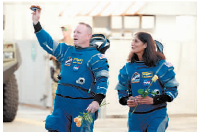
6月5日,在美国佛罗里达州卡纳维拉尔角,宇航员巴里·威尔莫尔(左)与苏尼·威廉姆斯准备执行载人试飞任务。

据新华社电 美国航天局20日发布消息,计划开展两项审查来决定如何让滞留国际空间站的两名美国宇航员安全返航。消息说,美国航天局将进行项目控制委员会审查以及飞行准备审查,预计将在8月底前就宇航员返航安排做出决定。