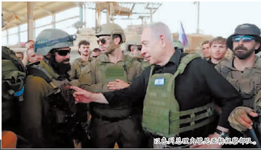
以色列总理内塔尼亚胡视察部队。