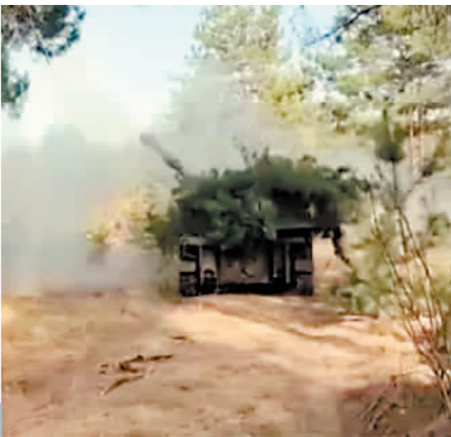
乌方在社交媒体上发布的乌军在俄罗斯库尔斯克地区展开行动的画面。