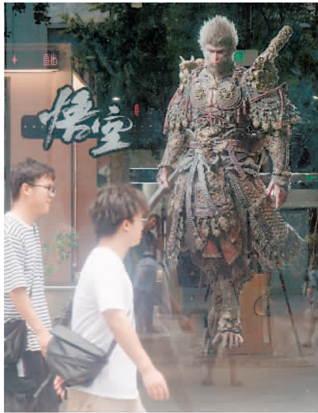
8月20日，在杭州街头，游戏爱好者从游戏《黑神话：悟空》中悟空的形象海报前走过。