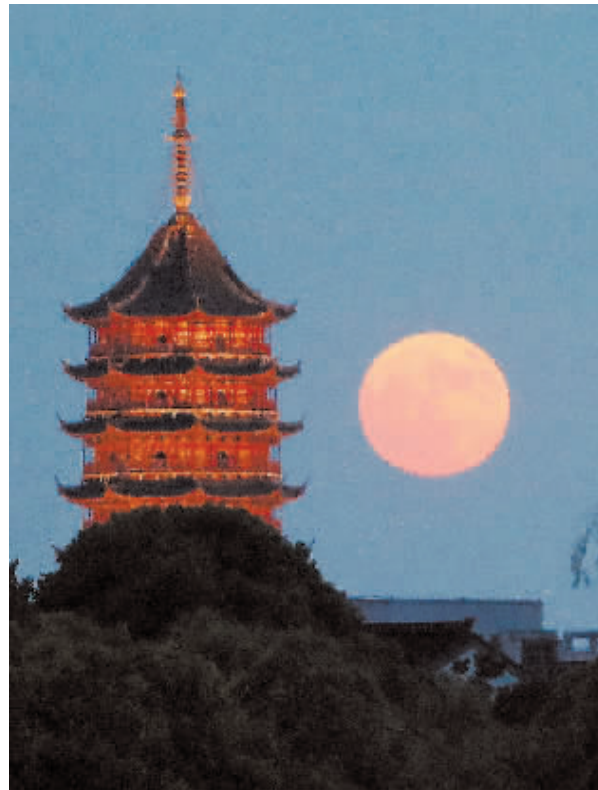
8月19日在江苏省苏州市拍摄的“超级月亮”。

据新华社电 8月20日凌晨，今年首个“超级月亮”如约现身夜空，我国天气晴好地区的公众于19日晚至20日凌晨拍到了这轮“胖月亮”。