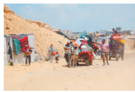
▲加沙民众撤离家园。 ▲在以色列与加沙边境拍摄的以军部队。