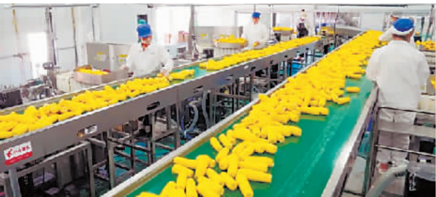
玉米生产企业开足马力忙生产。