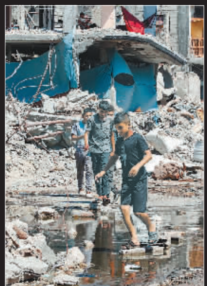
在加沙地带北部的杰巴利耶难民营,人们从建筑物废墟旁走过。