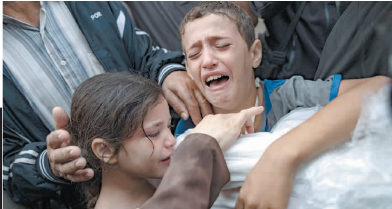
在加沙地带南部城市汗尤尼斯,人们哀悼以军袭击遇难者。

据巴勒斯坦加沙地带卫生部门15日发布的数据,去年10月新一轮巴以冲突爆发以来,以色列在加沙地带的军事行动已造成超过4万巴勒斯坦人死亡。加沙地带的人道灾难不断加剧,停火却迟迟无法实现,冲突的外溢效应正加速显现。国际社会呼吁尽快实现加沙全面永久停火,避免冲突对抗进一步升级。