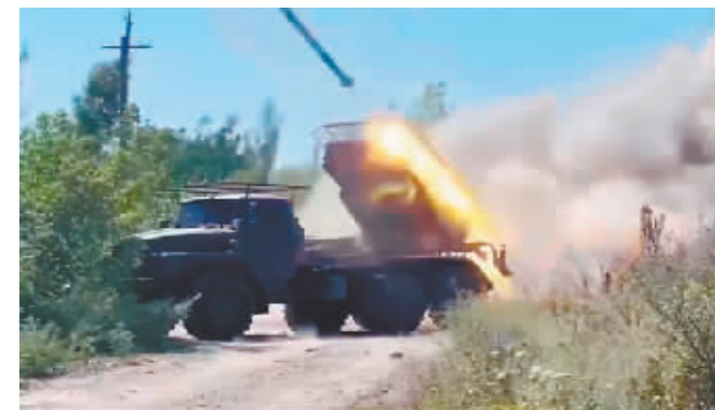
俄军对乌军进行攻击。

据新华社电 俄罗斯国防部14日发布通报说,截至目前,乌克兰军队在库尔斯克方向已损失2300人,俄军摧毁数十套乌军在俄境内武器装备。乌克兰总统泽连斯基14日在社交媒体上说,乌军在库尔斯克州的军事行动取得进展。