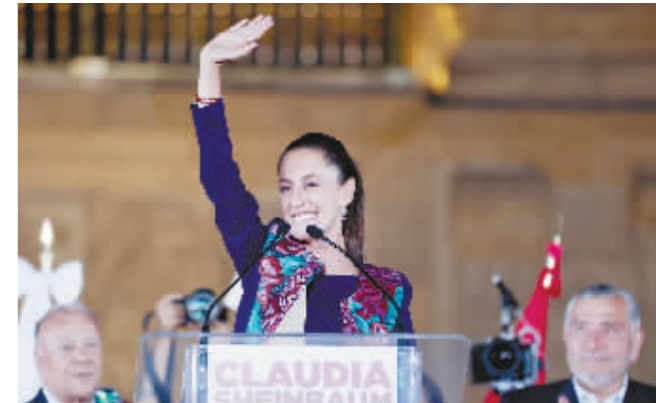
辛鲍姆在庆祝活动上挥手。

据新华社电 墨西哥联邦选举法院14日确认说,今年6月举行的总统选举结果有效。克劳迪娅·辛鲍姆正式当选墨西哥新任总统,她将于今年10月1日就职,成为墨西哥首位女性总统。