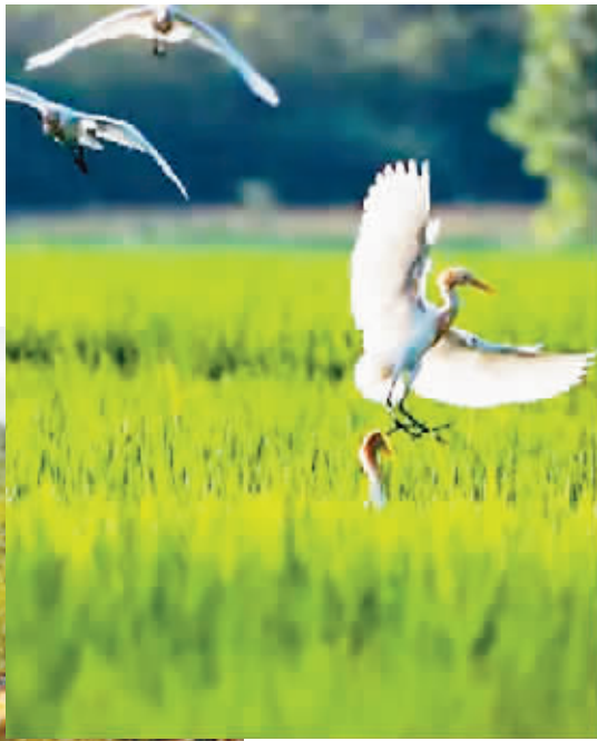
▲鹭鸟在山东省临沂市郯城县郯城街道水稻田间飞舞。