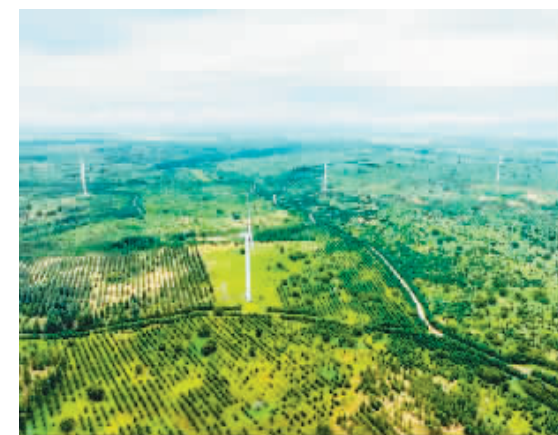
科尔沁沙地“双百万亩”综合治理工程努古斯台项目区内绿意盎然。

8月15日,迎来2024年全国生态日。林草年碳汇量居世界首位,森林面积连续40年增长,绿色产业遍地生花……绿水青山,风光无限,铺就中国高颜值生态答卷。