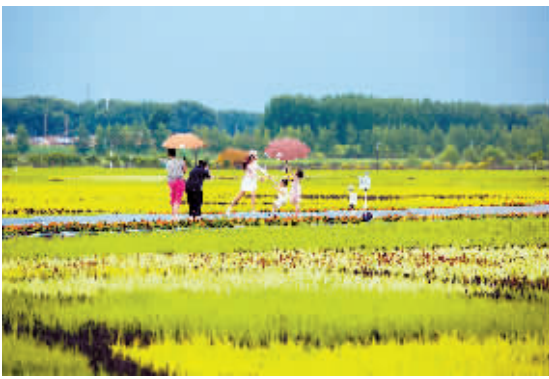
乡间小路