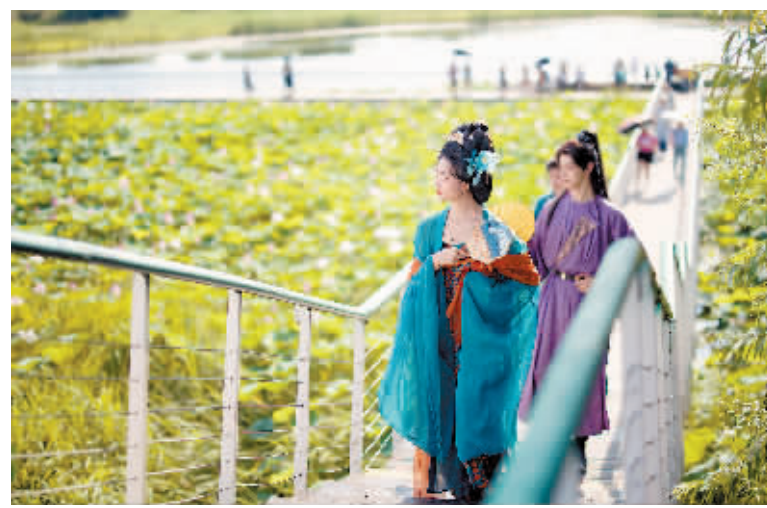
漫步赏荷