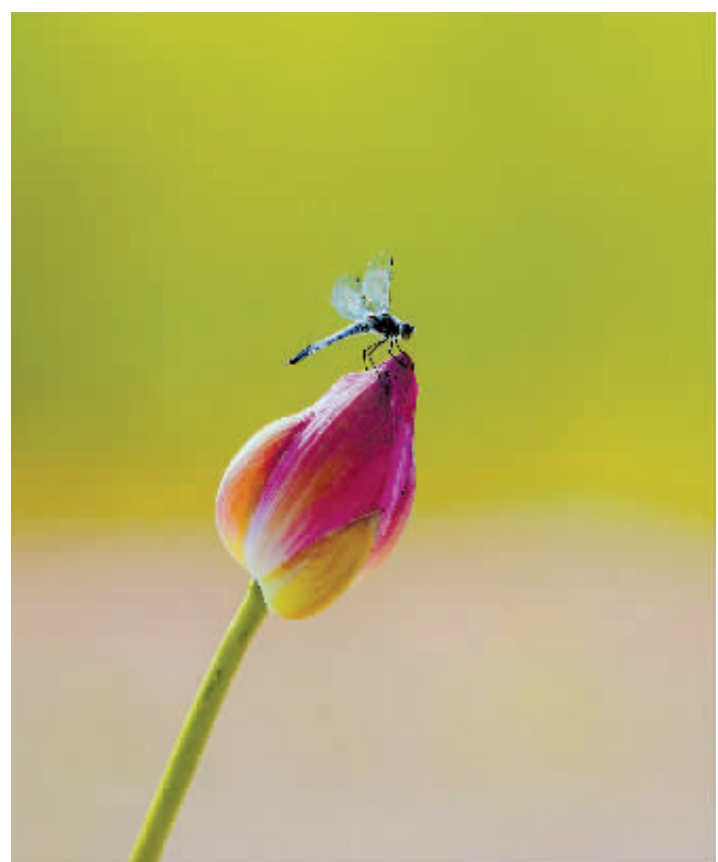
外滩湿地