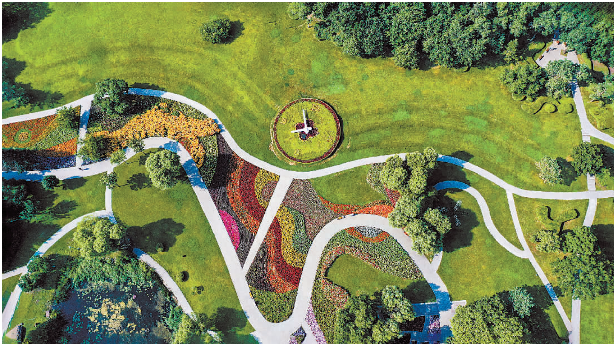
太阳岛百花园