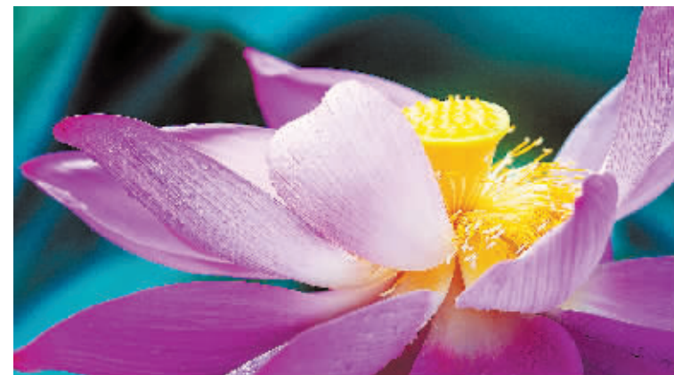
雨阳公园