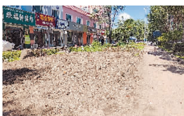
方正县同安街390号附近绿地裸露。