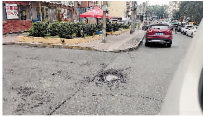
南岗区三姓街31号道路坑槽。