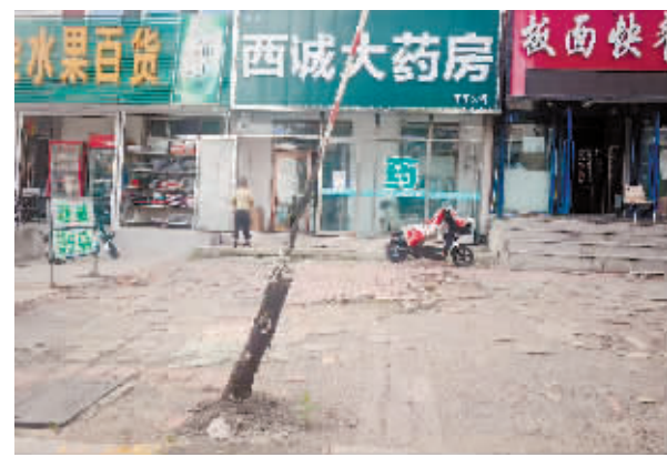
宾县大干路3号门前人行道破损、线缆不规范。