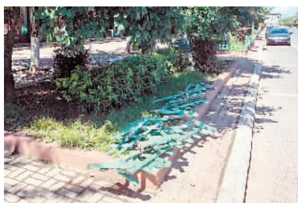
通河县铤子山大街福安楼门前绿地围栏破损。