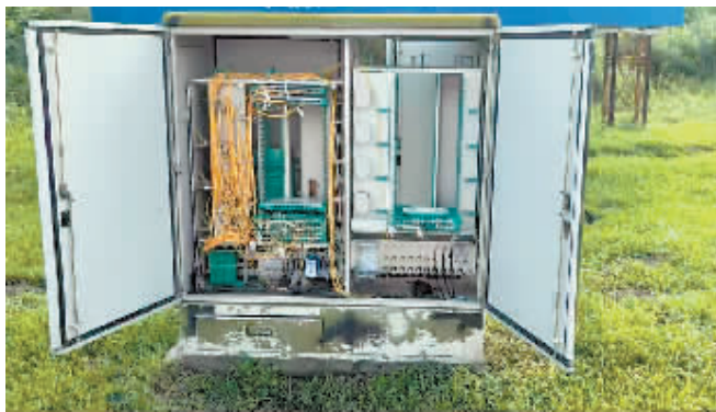
平房区哈南十二大道与松花路交口箱体破损。