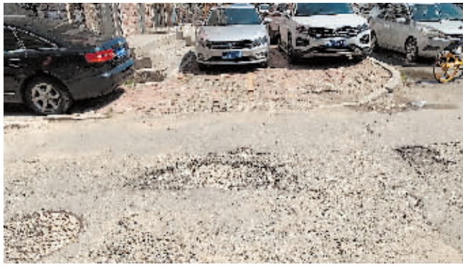
道外区丰润街177号道路破损。