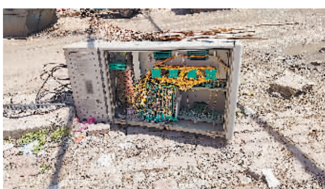
双城区先进街箱体破损倒伏、步道板破损。