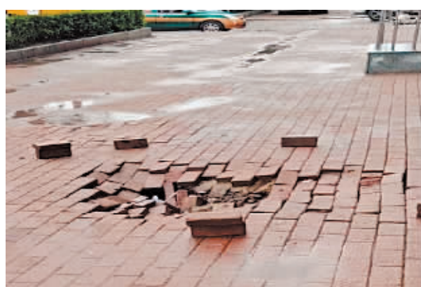
木兰县木兰镇中心路北段人行道塌陷。