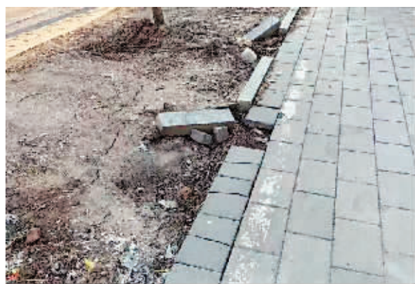
延寿县同庆街南侧商铺门前边石脱落、绿地裸露。