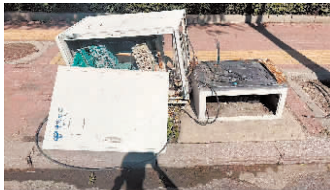
松北区江都街1123号旁箱体倾斜破损。