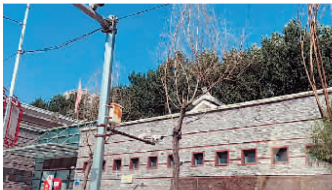
呼兰区南二道街萧红故居旁枯死树。