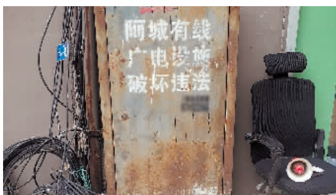
阿城区永泰乡企楼东山墙箱体锈蚀。