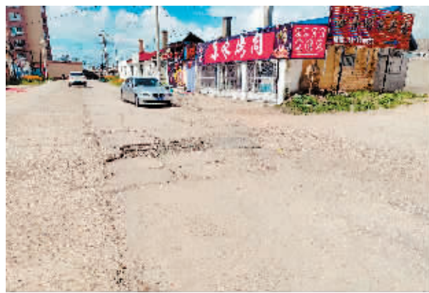
依兰县广播街原味烤肉门前道路破损。