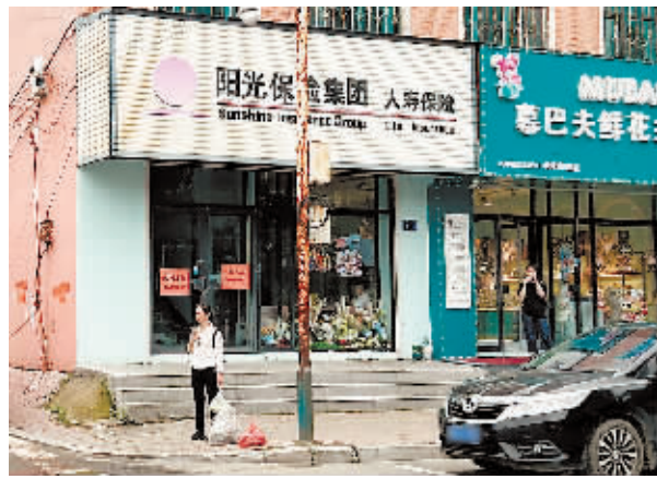
巴彦县北直路112号门前杆体锈蚀。