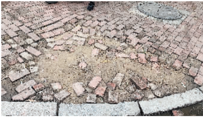
道里区安定街与安松街交口人行道道板缺失。

各区、县(市)各相关部门要对曝光的问题立行立改,坚持问题导向,落实属地主体责任,压实网格管理责任,集中时间、集中力量、集中设备逐条街路与点位开展整治。同时,要强化日常巡检查,确保整治工作取得实效,全面提升城乡环境品质,为亚冬会提供良好的城乡环境保障。