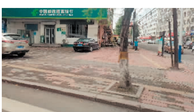
尚志市一曼路138号人行道道板破损。