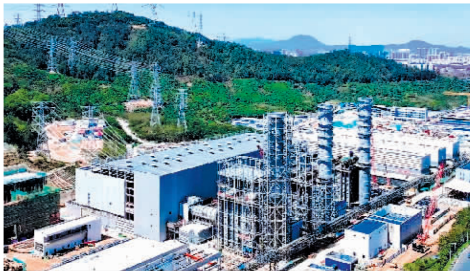
近日,哈电汽轮机承建的深圳能源光明电源基地项目1号燃气—蒸汽联合循环机组成功投运。

在云贵高原,盘江新光项目是我国西南地区首个超超临界二次再热火电项目,是贵州省推进新型工业化进程中着力打造的清洁能源标杆工程。近日,哈电锅炉公司研制的贵州盘江新光电厂两台660兆瓦项目的2