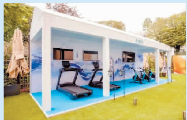
巴黎奥运会“中国之家”智慧健身区。

巴黎奥运会“中国之家”成为世界观察中国体育品牌的一扇窗口,中外参观者在这里亲身感受“中国智造”的魅力。