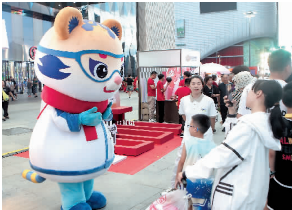
现场观众与亚冬会吉祥物互动。

首届消暑体育夜市还将健身展示体验区、体质检测咨询区、潮玩项目互动区、体育商品售卖区、体育彩票形象区和哈西168集市区共6大区域进行资源整合,以各具特色的品牌赛事、丰富多彩的互动体验、琳琅满目的体育用品市集,带动吃、喝、玩、娱、游、购,共同打造体育夜市“潮玩”主题,彰显时尚和运动,掀起贯穿整个夏季的体育消费热潮。