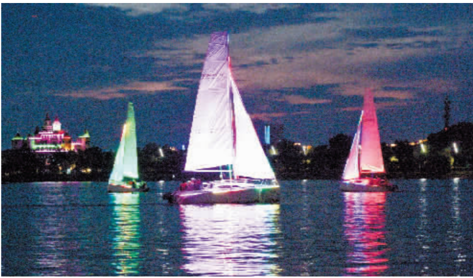
五彩斑斓的帆船秀点缀江面。

如何在晚间时段展现松花江之美和哈尔滨帆船文化魅力?市工人文化宫相关负责人张德东介绍,工会干部、职工开启“头脑风暴”,在帆船上安装百米长灯带、小型发电机和微电脑,经过20多天调试,7月23日晚,8艘带有4D灯光秀效果的彩帆成功亮起,扮靓松花江,也激起了冰城职工们为助力哈尔滨四季旅游热的服务热情。下一步,还要增加彩帆数量,让松花江的夜晚更美更灵动。