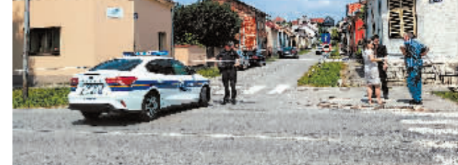
7月22日,在克罗地亚东部城镇达鲁瓦尔,警察封锁发生枪击事件的养老院。

新华社萨格勒布7月22日电 克罗地亚东部城镇达鲁瓦尔一家养老院22日发生枪击事件,造成6人死亡,6人受伤。凶手已被警方逮捕。