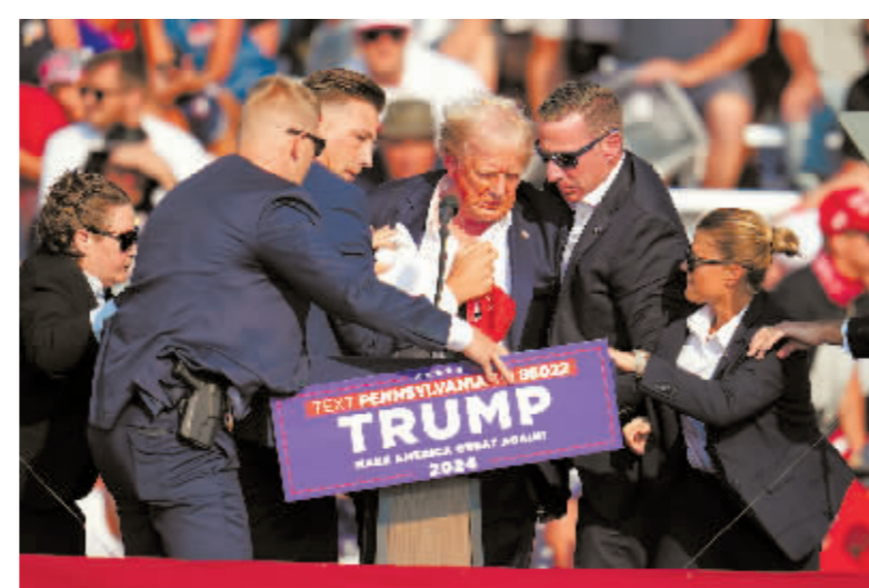
7月13日,美国前总统特朗普在宾夕法尼亚州巴特勒市的竞选集会现场被护送离开。

特朗普遇刺事件调查目前由联邦调查局牵头。奇特尔在听证会上仅披露部分调查发现——克鲁克斯似乎独自行动;调查人员发现他身上有引爆装置,正追查是否有人指导他制造爆炸物。按路透社说