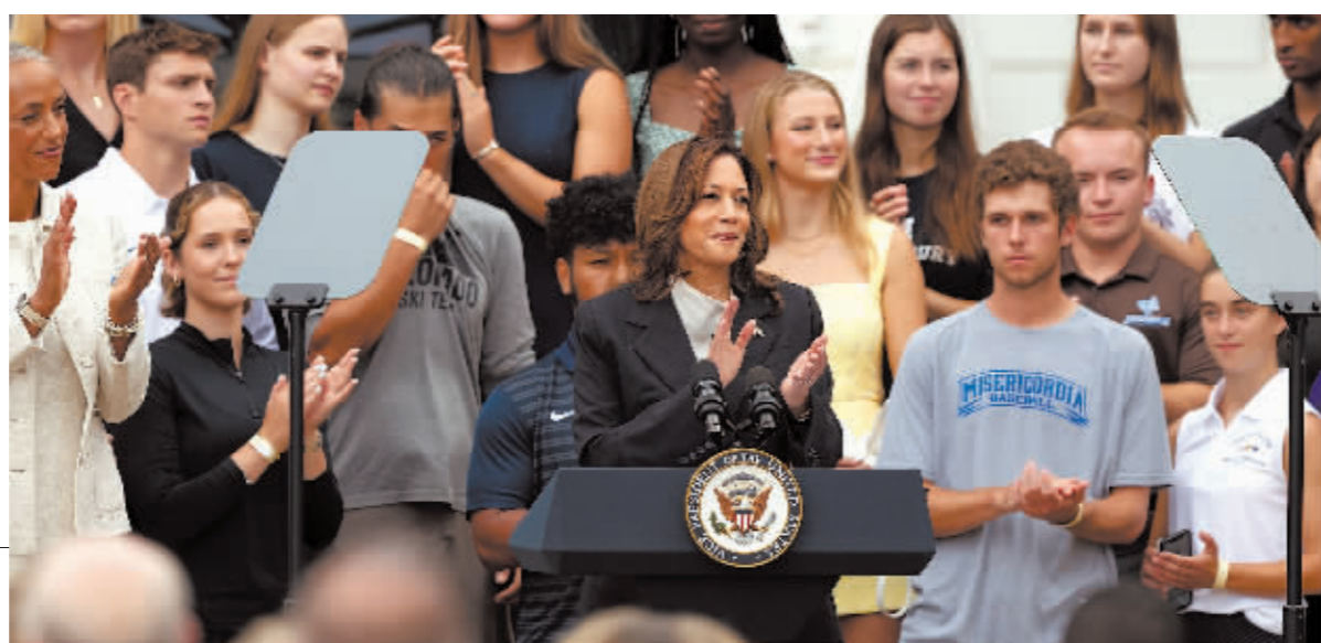
7月22日,美国副总统哈里斯(前中)在美国华盛顿白宫南草坪出席活动。

民主党全国代表大会定于8月19日至22日在芝加哥举行。据悉,民主党方面计划提前进行线上投票,正式确认党内总统候选人。今年美国大选投票日是11月5日。